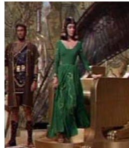
<그림 7> 와제트 문양의 녹색 드레스 <Cleopatra(1963).DVD