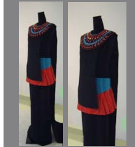
<그림 14> 클레오파트라 이미지의 드레스 실물 사진