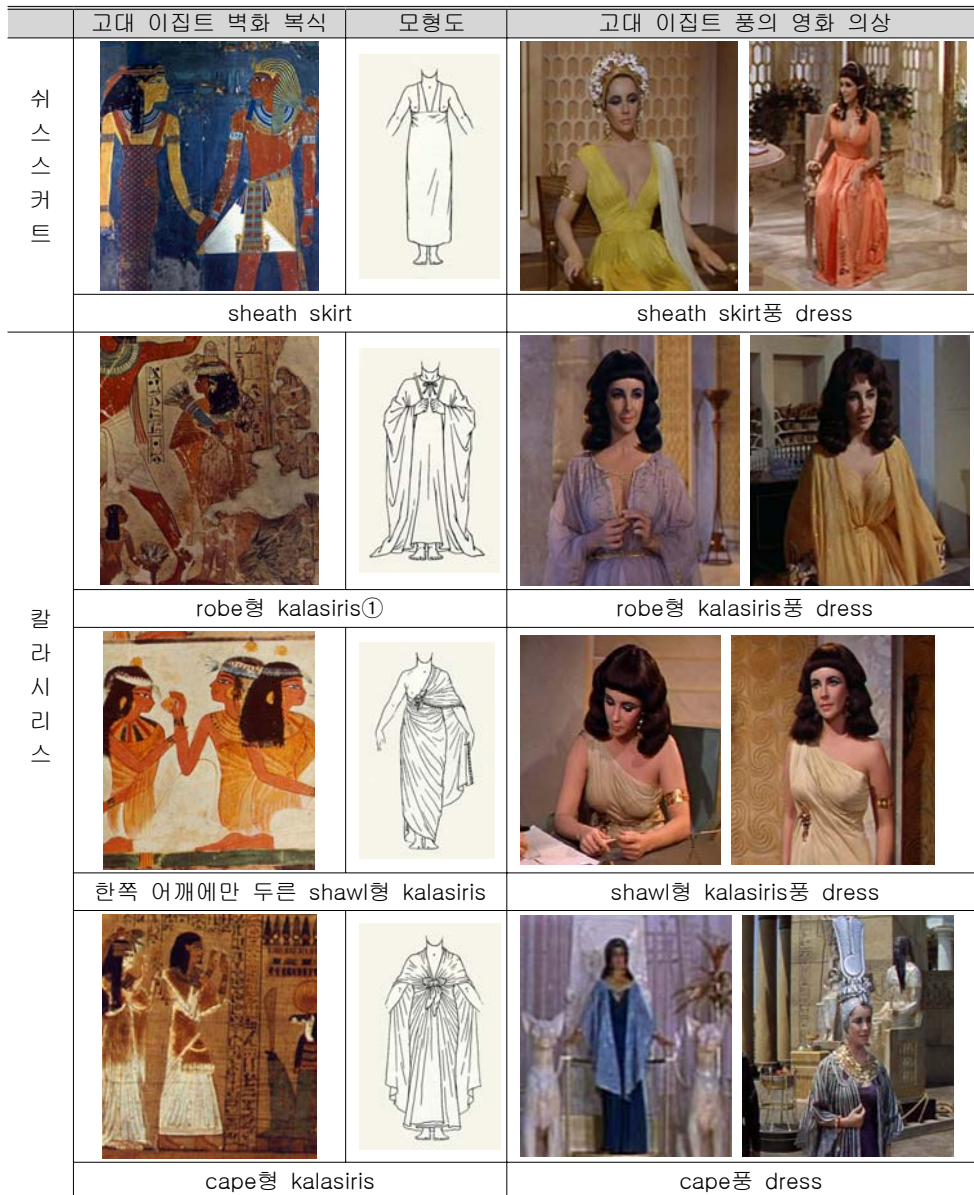
<표 3> 고대 이집트 풍으로 제작된 영화 의상

징성은 클레오파트라 의 복식 중 의상의 지문이나 자수, 장신구에 주로 나타나고 있다. 그 중에서 장신구는 문양과 색채가 결부되어 있긴 하지만 주로 문양으로 우의를 상징하고 있는데 비해, 의상은 문양보다는 색채로 우의를 표현하고 있다.