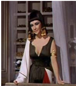
<그림 9> 흰색과 빨강을 배색한 검정 드레스 <Cleopatra(1963).DVD