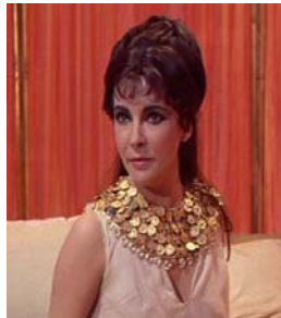
<그림 10> 금색 웨세크 <Cleopatra(1963).DVD