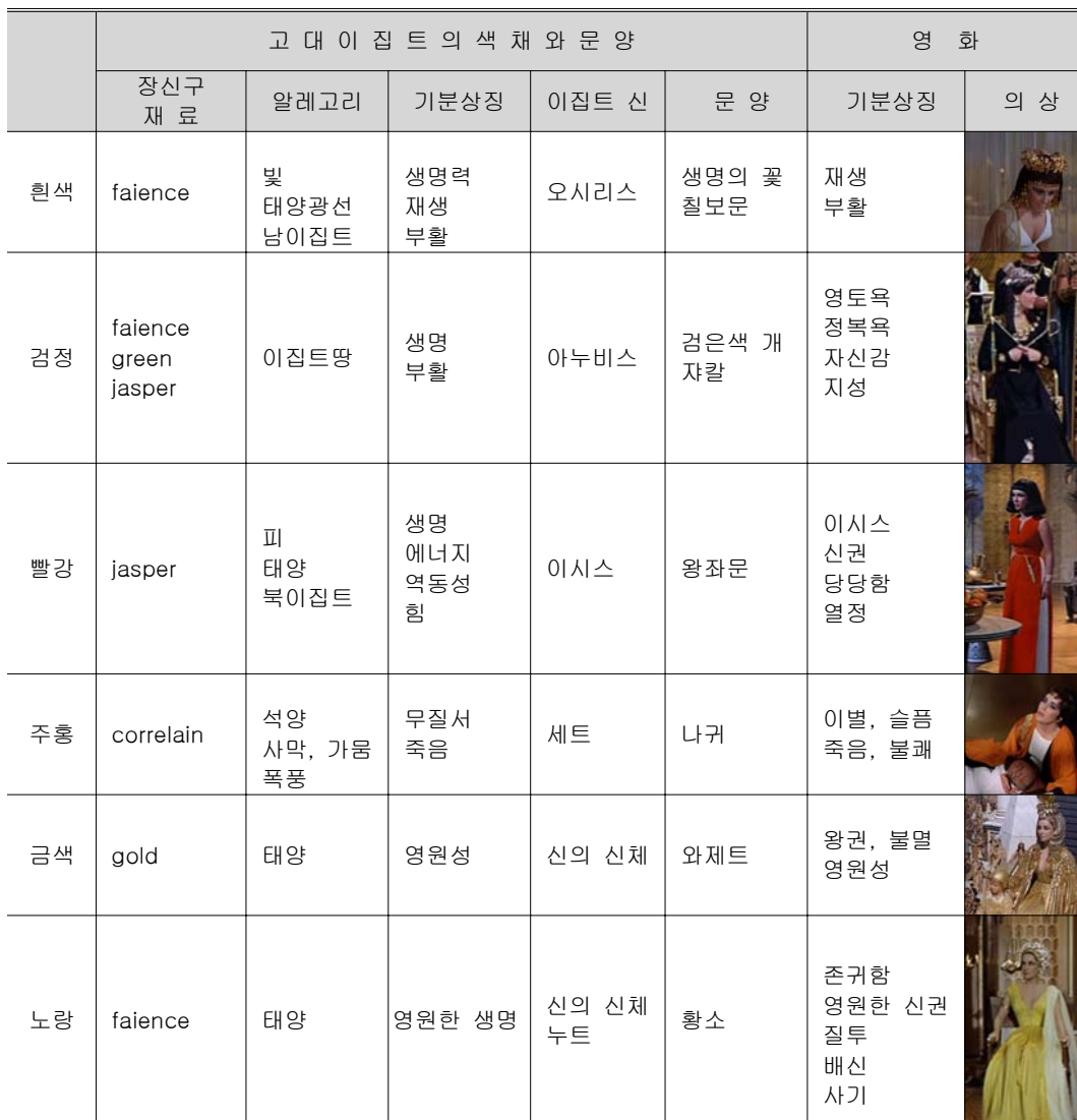
<표 4> 영화 <클레오파트라>에 나타난 색채와 문양의 상징성

그러므로 후속 연구로 영화 <클레오파트라>의 다양한 이미지 중에서 색채와 문양별로 디자인 기획을 해 보거나 헤드 드레스, 헤어스타일, 화장과 같은 세부적인 분야의 디자인을 연구해 보는 것도 의미 있다고 생각된다.