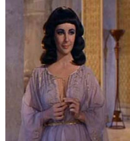
<그림 4> 칼라시리스폰 드레스 <Cleopatra(1963).DVD