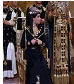
<그림 11> 검정색 드레스 <Cleopatra(1963).DVD