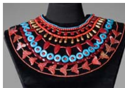
<그림 13> 레드 웨세크