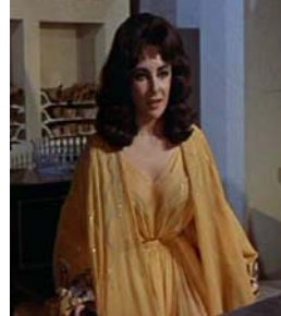
<그림 3> 칼라시리스폰 드레스 <Cleopatra(1963).DVD