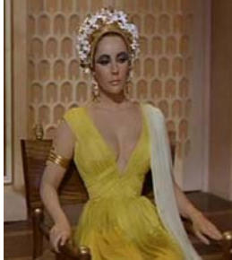
<그림 1> 시스 스커트폰 드레스 <Cleopatra(1963).DVD