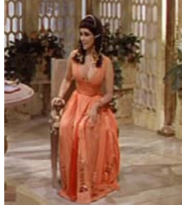
<그림 2> 시스 스커트폰 드레스 <Cleopatra(1963).DVD