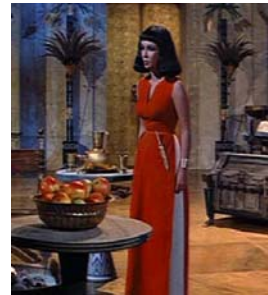
<그림 8> 이시스신상정의 빨강 드레스 <Cleopatra(1963).DVD