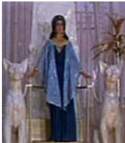
<그림 5> 케이프풍 드레스 <Cleopatra(1963).DVD