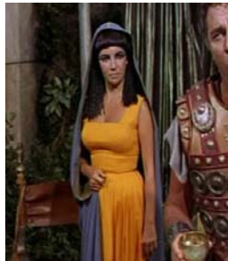
<그림 6> 스퀘어 네크라인 드레스 <Cleopatra(1963).DVD