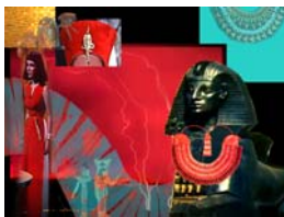
<그림 12> Kemeto of Cleopatra 이미지맵