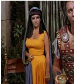
<그림 17>스퀘어 네크라인 드레스 <Cleopatra(1963)>.DVD