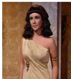
<그림 10> 한쪽어깨에만 두른 shawl 형 kalasiris 풍의 드레스 <Cleopatra(1963)>.DVD