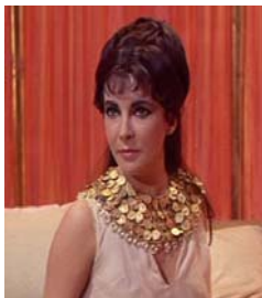
<그림 21> 1960년대 헤어 스타일 <Cleopatra(1963)>.DVD