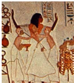
<그림 6> 로브형 칼라시리스(㉔-b형) Ancient Egypt Discovering Its Splendors, p.231.