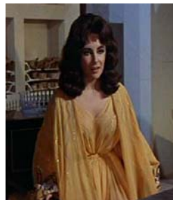
<그림 7> 노란색 칼라시리스풍 드레스 <Cleopatra(1963)>. DVD