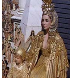
<그림 26> 황금색 드레스 <Cleopatra(1963)>.DVD

左 : Egypt : The World of The Pharaohs, p.246. 右 : 世界美 術大系 : エジプト美術, p.69.