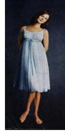
<그림 16> 얇은 옷감의 슈미즈 드레스 vogue(1964, April 15), p.42.