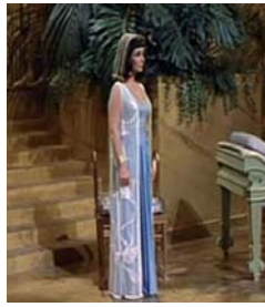
<그림 30> 흰색 카프탄 <Cleopatra(1963)>.DVD