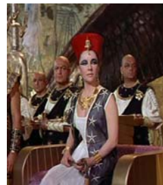
<그림 23> 검정색 카프탄 <Cleopatra(1963)>.DVD