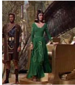
<그림 18> 녹색 드레스 <Cleopatra(1963)>.DVD