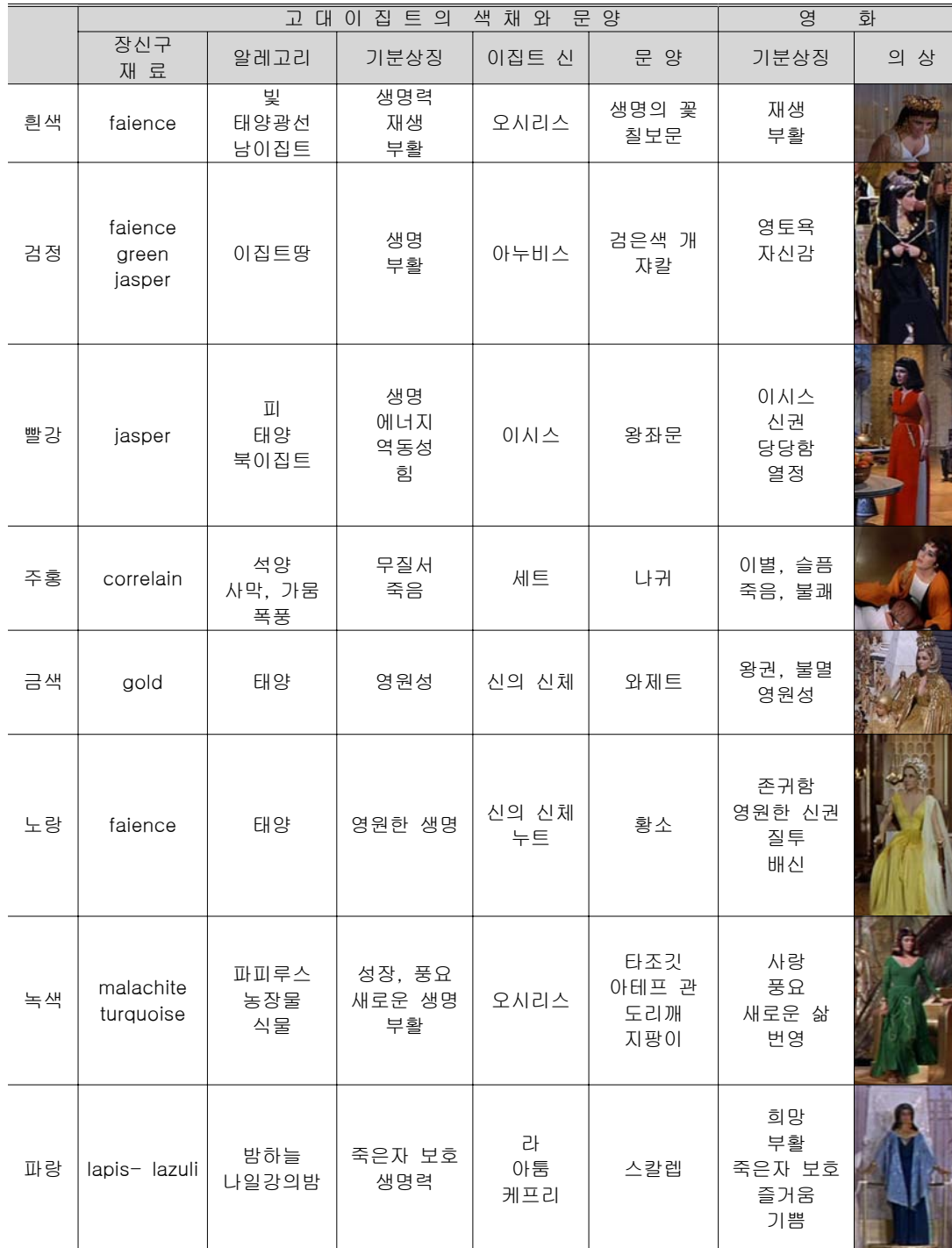
<표 2> 영화 <클레오파트라>에 나타난 색채와 문양의 상징성