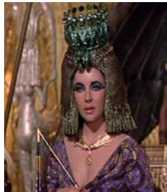
<그림 31> 와제트 관 <Cleopatra(1963)>. DVD