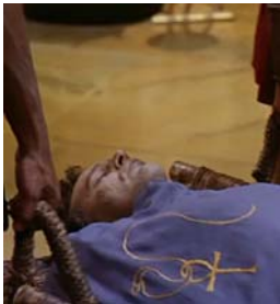
<그림 29> 양크 문양이 있는 cape <Cleopatra(1963)>.DVD