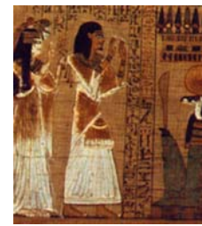
<그림 12>cape와 skirt형 kalasiris Egypt, the world of the pharaohs, p.401.