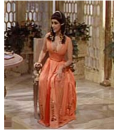
<그림 3> 주홍색 쉬스 스커트풍 드레스 <Cleopatra(1963)>. DVD