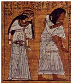
<그림 5> 칼라시리스 Treasure of the pharaohs, p.159.