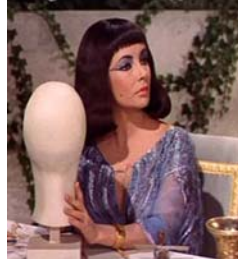
<그림 14> 단발머리형 헤어스타일 <Cleopatra(1963)>. DVD