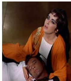
<그림 22> 주홍색 드레스 <Cleopatra(1963)>.DVD