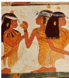
<그림 9>한쪽어깨에만 두른 shawl 형 kalasiris 世界美術大系 : エジプト美術, p.39.