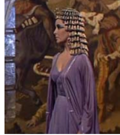
<그림 27> 헤드 드레스 <Cleopatra(1963)>.DVD