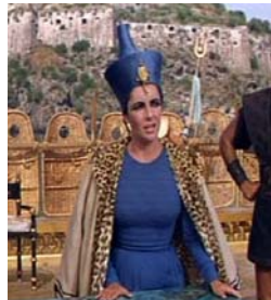
<그림 32> 파란색 드레스 <Cleopatra(1963)>.DVD