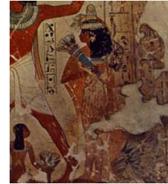
<그림 4> 로브형 칼라시리스 Treasure of the pharaohs, p.81.