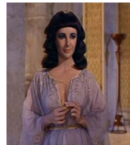
<그림 8> 칼라시리스풍 드레스 <Cleopatra(1963)>. DVD