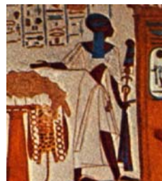
<그림 11> cape와 skirt 형 kalasiris. Ancient Egypt Discovering Its Splendors, p.231.