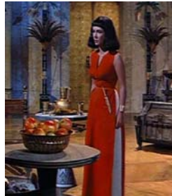
<그림 19> 빨간색 드레스 <Cleopatra(1963)>.DVD