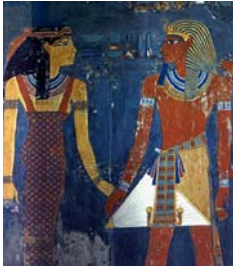
<그림 1> 쉬스 스커트 大系 世界の美 : エジプト美術, p.96.

이러한 상징성들은 역사적 회귀와 이국취미를 통해 다시 재현되고 있다. 그러므로 후속 연구로 헤드 드레스에 표현된 상징성이나, 헤어스타일, 화장과 같은 세부적인 분야에 관해 고찰 해 보는 것도 의미 있다고 생각된다.