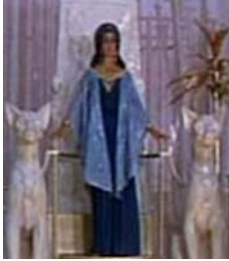
<그림 13> cape풍 드레스 <Cleopatra(1963)>. DVD