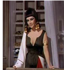
<그림 20> 흰색과 빨강을 배색한 검정 드레스 <Cleopatra(1963)>.DVD