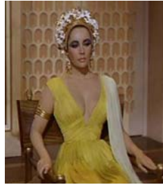
<그림 2> 쉬스 스커트풍 드레스 <Cleopatra(1963)>. DVD