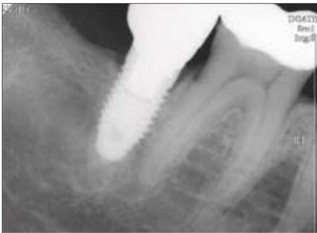
Fig. 1. An implant-supported single crown placed in lower 2nd molar site with minimal distance were followed after 5 years.

임플란트 지지 단일 금관으로 최후방치아를 수복한 환자의 진료기록부를 분석하였다. 환자의 성별, 나이, 임플란트 실패 여부, 임상적 합병증의 종류 및 빈도를 조사하였다. 식립된 시간으로부터 마지막으로 정기 검진을 위해 내원한 시점 까지를 관찰 기간으로 설정 하였고 이 기간 동안 식립된 매식체가 식립 부위에서 제거 된 것과 수복된 금관이 합병증으로 인해 재 제작 혹은 치료를 받은 시점 까지 누적된 관찰 기간에 대해 분석 하였으며 임플란트와 인접 치간의 거리가 생존율에 미치는 영향을 통계적으로 비교 분석 하였다. 인접 거리는 방사선 사진을 통하여 측정 하였다. 대상환자에 대해 임플란트 식립 후, 보철물 장착 시, 그 후 매년 정기 검사 시에 방사선 촬영을 시행하였다. 방사선