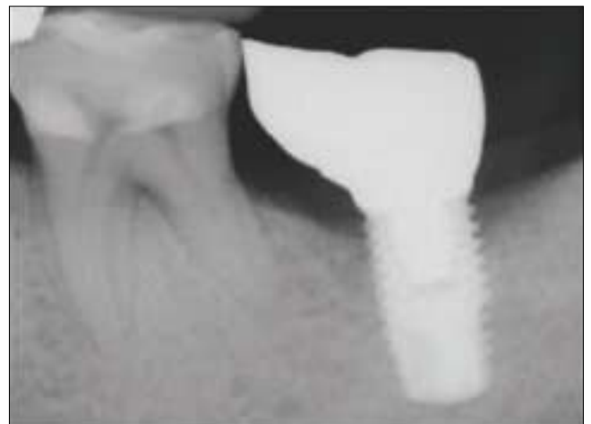
Fig. 2. A most posterior mandibular single crowns with mesial cantilever