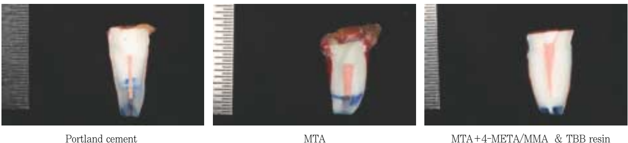
Figure 2. Buccolingual sectional view of each group with methylene blue dye penetration.

* means statically significant difference