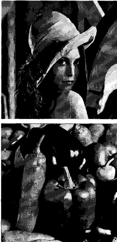
그림 6. CSMVQ 압축 결과

일반 VQ나 SMVQ의 압축 결과에 워터마크를 삽입할 경우 이미지 품질이 추가적으로 악화됨을 관련 연구 [2][4][5]의 결과는 잘 보여준다. [표 2]는 자체적인 구현과 관련 연구에 대한 인용을 통해서 일반 VQ, SMVQ, CSMVQ의 압축 품질과 워터마크 삽입 후의 품질을 정리한 것이다. 여기에서 일반 VQ에 의한 압축과 워터마크 삽입 품질은 Jo와 Kim[2]의 VQ 워터마킹 방법을 자체적으로 구현하여 얻은 값이고, SMVQ에 의한 압축과 워터마크 삽입 품질은 크기가 512인 코드북과 크기가 256인 상태 코드북을 이용한 Chang, Tai, Lin[15]의 실험결과를 인용한 것이다. CSMVQ에서는 제로-워터마크를 사용하므로, 이에 따른 추가적인 품질 악화는 없다. SMVQ 압축에 의한 이미지 품질이 CSMVQ보다 못한 상태이므로, 워터마크를 삽입한 후의 이미지 품질은 당연히 CSMVQ가 우수하다. [표 1]에서와 마찬가지로, CSMVQ의 품질은 일반 VQ보다 약간 부족하나,