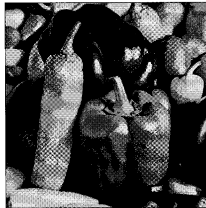
그림 5. 실험에 사용된 흑백 Lena와 Peppers 이미지