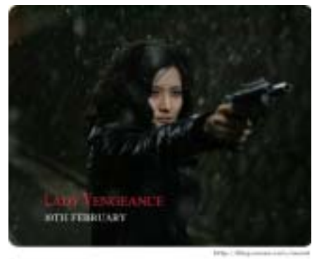
<그림 11> 친절한 금자씨.