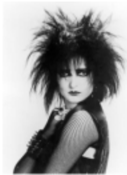
<그림 2> 수지 수.