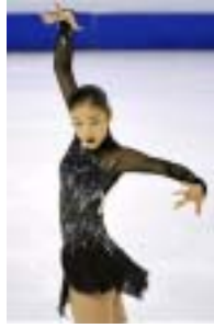
〈그림 15〉 김연아.