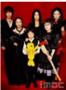
<그림 9> 안녕, 프란체스카.

국내에서도 고스 이미지의 영화나 TV 드라마, 공포·환타지 소설들이 대중들에게 많은 인기를 끌게 되었는데 이는 비현실적인 환상성이 대중들에게 매력적인 요소가 되고 있음을 알 수 있다. MBC TV 시트콤 <안녕, 프란체스카>(2003)가 우리나라 대중들에게 처음 고스 문화를 알린 계기를 마련하였다고는 하나, 사실 고딕적 요소를 가진 드라마는 이미 대중들에게 많은 인기를 끌어 왔다. 예를 들어 1970년대부터 80년대 KBS에서 공포극의 정수였던 <전설의 고향>, 시청률 50%라는 경이적인 기록을 세웠던 공포 스타일러물인 MBC 드라마 <M>(1994), 선과 악의 대립으로 팽팽한 긴장감을 주었던 SBS에서 방영된 공포 드라마 <고스트>(1999) 등이 있다. 21세기의 공포 드라마는 고딕의 전통적인 이미지를 코믹적 요소나 액션, 멜로 같은 다른 요소와 결합하여 변형을 시도하였다. 시트콤 <안녕, 프란체스카>는 흡혈귀를 등장시켜 인간사회를 풍자하고 코믹한 요소를 가미한 드라마로 여기에 등장하는 주인공격인 뱀파이어 가족은 전형적인 고스족들이다. 이들의 패션은 기본이 검은 색상이며 검은 드레스에 길게 늘어뜨린 머리카락, 창백한 하얀 얼굴에 붉은 입술의 메이크업을 하여 고스리풍의 복식을 취하고 있음을 알 수 있다(그림