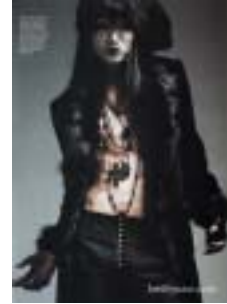
〈그림 21〉 덴디 고스 룩.

주어 소녀풍 이미지의 핑크 고스 룩을 보여 주고 있다. 〈그림 18〉은 고성을 배경으로 하였지만 어둡고 음산하지 않은 고스 이미지로 블랙 앤 화이트의 스팅글 드레스, 니트 소재의 블랙 코트와 프린지 디테일의 목장식은 모던하고 드라마틱한 이미지를 보여주고 있다. 그리고 동양풍의 헤어스타일과 가는 눈썹이 독특한 스모키 화장은 신비롭고 환상적인 로맨틱 고스 이미지를 더해주고 있다. 〈그림 19〉에서는 에블린 드 모건(Evelyn De Morgan)의 〈죽음의 천사〉를 연상케 하는 고스 이미지로 블랙의 베스트와 팬츠의 단순한 아이템과 자극적인 스모키 화장, 블랙의 날개장식은 죽음을 느끼게 하는 강렬한 아방가르드 이미지를 연출하고 있다. 〈그림 20〉은 글리터리한 소재와 광택 소재로 매치한 러플이 달린 바디라인을 드러나는 미니원피스는 섹시하고 여성적이다. 부분적인 가슴 노출과 망사 스타킹은 섹시한 이미지를 더해 주고 있으며, 스모키 화장과 긴 머리, 블랙 스타일은 섹시 고스 룩을 표현해 주고 있다. 〈그림 21〉은 고급스러운 모피 디테일이 강조된 재킷 스타일이 모던하고 시크한 남성적 이미지를 주는 덴디 스타일이다. 십자가 목걸이와 메탈 액세서리, 붉은 눈 화장과 핏빛 입술, 긴 머리는 음산하지만 고풍적이고 섹시한 이미지로 고스 패션의 진수를 보여주고 있다.