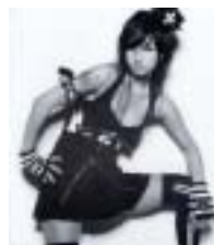
<그림 12> 이효리

가수 이효리는 2집 앨범 재킷 사진에서 ‘다크엔젤’을 컨셉으로 한 핑크 고스풍의 이미지를 잘 보여 주고 있다. <그림 12>에서 흐트러진 검은 머리와 블랙 네일, 스모키 화장은 고희적인 매력을 보여주고 있으며, 블랙의 미니원피스와 십자가가 이미지가 강한 헤드드레스와 박쥐모양의 팔 장식은 귀엽고 섹시한 고스 이미지를 보여주고 있다. 아이돌 스타 SS501은 1집 앨범에서부터 강렬한 핑크 고스 룩으로 시선을 모았다. <그림 13>에서 보면 블랙을 기본 색상으로 한 의상은 가죽 점퍼, 품이 넓은 롱 코트, 오리엔탈 느낌의 짧은 재킷, 셔츠와 가죽 조끼, 블랙 진바지를 이용하여 개성 있는 레이어드 룩을 연출하고 있다. 액세서리로는 펜타클이나 해골 모양의 버클이 강렬한 벨트, 십자가나 거미줄 모양의 목걸이, 귀걸이와 반지, 깃털이나 니트, 벨벳 재질의 목도리, 굽이 높은 통굽 워커로 코디하였다. 헤어스타일은 블랙과 옐로우로 염색하였으며, 창백한 얼굴에 스모키 화장으로 고스 이미지를 재해석하여 핑크풍의 강렬하고 섹시한 느낌을 표현해 주고 있다. 가수 아이비는 ‘유혹의 소나타’란 곡의 안무에서 부채를 들고 주문의 거는 동작의 섹시하고 신비스러운 마녀춤으로 큰 인기를 누렸