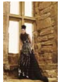
〈그림 18〉 로맨틱 고스 룩.