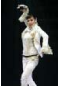
〈그림 14〉 아이비.