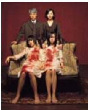
<그림 10> 장화홍련.