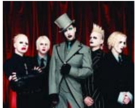
<그림 3> 마릴린 맨슨.