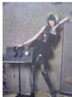
〈그림 17〉 핑크 고스 룩.

〈그림 17〉에는 가죽과 레이스의 이질적인 소재 매치로 독특한 이미지를 연출하는 블랙 원피스에 장식식이 화려한 블랙 베스트, 블랙 롱부츠에 메탈 액세서리, 스모키 화장과 금빛 헤어 갈라로 포인트를