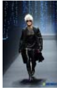
〈그림 25〉 한승수 '08~09 F/W.