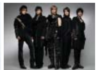
<그림 13> SS501.