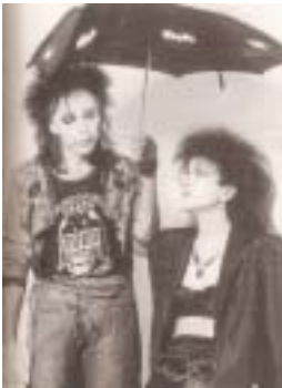
<그림 1> 뱃케이브 패션.

음악은 고스 하위문화의 정체성을 규정하고 이해하는데 중요한 요소이다. 고스 하위문화는 1970년대 말에 발생한 포스트 펑크(Post punk)라고 알려져 있는 음악 장르와 밀접한 관련이 있다. 고스는 1979~82년 사이 주요한 미디어의 주목을 끌기 시작하였지만, 고스 문화를 알리게 된 중요한 사건은 1982년 7월 런던에 문을 연 뱃케이브(Batcave) 클럽이다(그림 1). 이곳에서 밴드들이 펑크 고스 록을 연주하게 되면서 많은 매체의 주목을 받게 되었으며 새로운 하위문화의 인식을 발전시켜 나갔다 14) . 펑크를 음산하게 변주하기 시작했던 조이 디비전(Joy Division), 바우하우스(Bauhaus), 수지 앤 더 밴쉬즈(Siouxsie and the Banshees)(그림 2), 1980년대의 시스터즈 오브 머시(The Sisters of Mercy), 큐어(The Cure), 마릴린 맨슨(Marilyn Manson)(그림 3) 등은 고딕 이미지를 정착시키는데 중요한 역할을 하였다 15) . 고스 음악은 펑크와 고딕적인 색채를 가미하여 어둠의 세계를 지향하고 인간 내면의 광기를 표현하였으며, 비극적인 아름다움을 간직한 암울한 가사, 몽환적인 저음, 낮은 베이스음으로 포스트모던적 감수성을 나타냈다 16) . 이후 1990년대에는 고딕 메탈이나 인더스트리얼 메탈에 이르기까지 고스 음악은 유동적이고 광범위한 스타일로 다양하게 발전하였