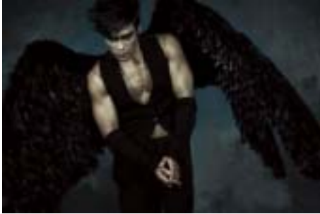
〈그림 19〉 아방가르드 고스 룩.