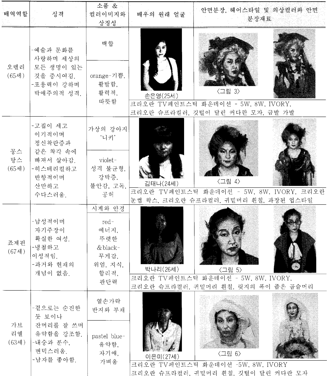
〈표 1〉 〈사이오의 광녀〉 성격분장표

색 계열의 컬러를 사용하였다. 주름의 표현은 네 사람 중 가장 연장자임을 고려하여 굴곡과 깊이감을 더 잘 표현하기 위해 다른 배역인물에 비해 화이트