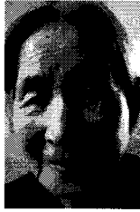
〈그림 1〉 실제 70대 초반 노인 이미지