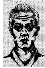
〈그림 2〉 노인 얼굴의 굴곡 일러스트 한국분장예술, 2001, p. 55