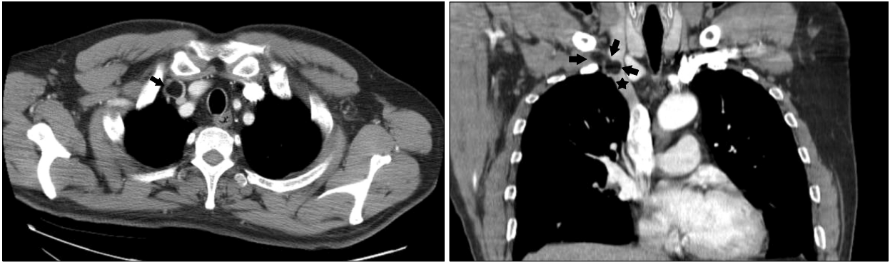
Figure 1. The contrast-enhanced chest CT scans show a filling defect (arrows) with fatty tissue attenuation with right subclavina vein and right brachiocephalic vein (★).