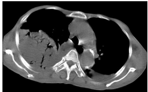
Figure 2. Chest CT on admission Large multiloculated pleural empyema with numerous air bubble is shown in right pleural space.

SMG 감염은 60세 이상의 고령에서, 여성보다는 남성에서 3~5배 정도 높게 호발하는 경향을 보인다 2,3 . SMG는 구강과 인두부에 정상 상재균으로 존재하다 구강분비물의 흡입, 혹은 점막 손상 시 그 아래 부위에서 직접적으로 농양을 형성하거나 혈행성 전파를 통해 농흉을 일으킨다 4 . 폐렴은 SMG로 인한 농흉의 가장 흔한 유발인자이며, 이외에도 만성폐쇄성폐질환, 흉부 수술, 종양, 신경계 질환, 알코올 남용, 당뇨, 스테로이드의 사용 등이 SMG에 의한 농흉의 유발인자로 알려져 있다 3 .