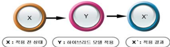
<그림 1> 연구 수행 과정

그리고 쓰기 평가를 위해서는 Imagine Learning 수준 측정 콘텐츠를 활용한다. 구체적인 통계처리방법은 학습자들의 하이브리드 모델 적용 전후 점수의 차이를 SPSS/WIN 15.0 프로그램을 이용하여 T-테스트로 비교한다.