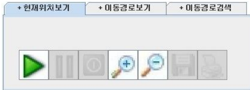
그림 8 현재위치보기 메뉴

그림 8과 그림 9의 현재위치보기와 이동경로보기 메뉴를 이용하여 맨 왼쪽부터 시작, 일시정지, 정지, 확대, 축소 등의 버튼을 이용하여 프로그램을 구동 시킨다. 먼저 재생버튼을 누르면 데이터베이스에 있는 해당 클라이언트의 GPS좌표를 가져와서 일련의 변환과정을 거친 후 클라이언트의 위치가 해당 지도에 표시되게 되고 일시정지와 정지버튼을 통해 위치 추적을 멈추거나 종료할 수 있다.