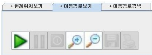
그림 9 이동경로보기 메뉴

현재위치는 데이터베이스에 실시간으로 데이터가 저장되기 때문에 현재시간과 비교해서 가장 가까운 데이터를 보여주게 된다.