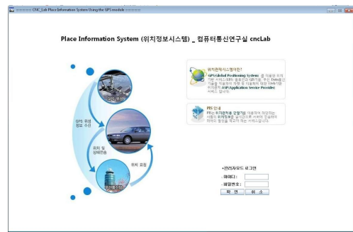
그림 5 응용 프로그램 초기 구동 화면

초기에 응용 프로그램을 구동 시키면 그림 5와 같은 초기 화면이 생기고 우측 하단에 로그인 창을 통하여 로그인이 가능하다.