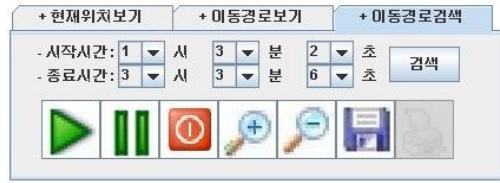
그림 10 이동경로보기메뉴