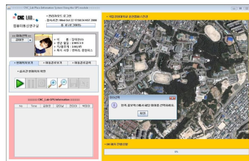
그림 6 관리자모드 로그인 후 화면(강원대학교 춘천캠퍼스 지역)

로그인 후에는 자동으로 데이터베이스에 연결되고 미아의 선택에 따라 데이터베이스에서 데이터를 가져오게 된다. 그림 6은 로그인 후 초기 화면을 나타내고, 그림 7은 미아 선택 메뉴를 나타낸다.