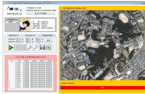
그림 11 이동경로 검색결과

아래 그림 10의 이동경로보기메뉴에서 시작시간 및 종료시간을 조절하여 검색을 누르면 그림 11에서처럼 프로그래스바를 이용하여 패치정도를 알려주고 좌측에 있는 표에 시간과 각 클라이언트의 위치를 기록한다.