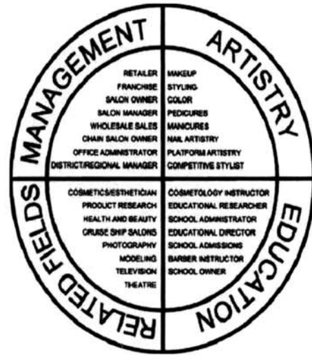
Fig. 2. 뷰티산업 분류2

삼성경제 연구소에서는 최근 뷰티산업의 영역을 다음의 네 가지 카테고리 미모(美貌), 미관(美觀), 미담(美談), 미품(美品)으로 구분했다. 이것은 뷰티라는 개념이 일반적으로 떠올리는 화장품 산업, 그리고 미용성형 산업에만 국한되는 개념이 아니라는 것을 짐작하게 한다. 뷰티산업 즉, 뷰티(Beauty)의 산업적 영역은 미적 디자인, 감동, 체험 등이 가미된 다양한 체험과 소비를 망라한다. 즉, 인간의 감성차원의 욕구를 채워줄 수 있