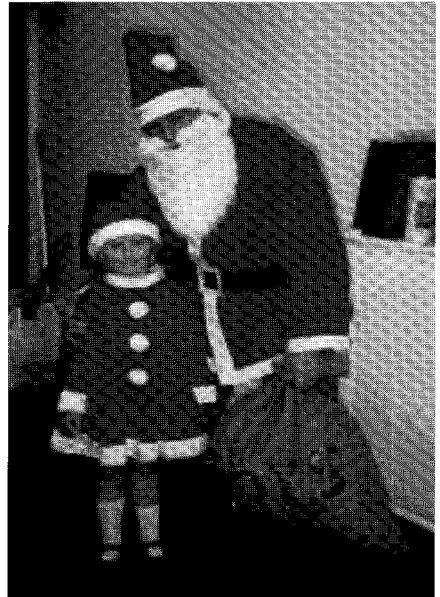
‘워클리 도서관의 친구’ 회원 한 분이 도서관의 어린이를 위한 크리스마스 행사의 하나로 산타클로스로 분장한 모습

도서관의 친구는 일주일에 두 번씩(수, 금요일 아침) 도서관 열람실에서 커피모닝을 주관 한다. 커피모닝은 지역주민 혹은 도서관 이용자들이 도서관 내의 열람실에서 커피를 마시고 비스킷을 먹으면서 이웃주민과 다른 이용자 그리고 사서들과 이야기를 나눌 수 있도록 마련된 자리이다. 사람들은 이 모임에 참석하여 이웃들과 담소를 나누고 자리를 뜰 때 한아름의 책을 빌려 간다. 도서관의 친구는 이 활동을 통해서 기금을 모으고 사람들을 도서관으로 끌어들이는다.