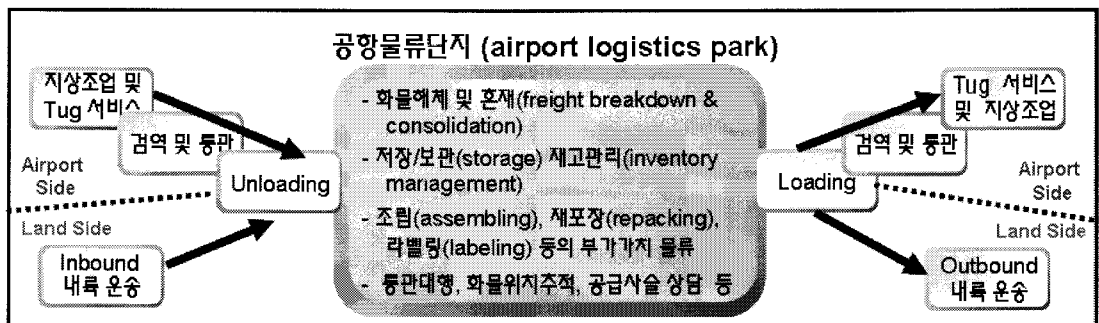
그림 1. 공항물류단지의 주요 물류기능

일반적으로 공항물류단지 또는 화물터미널에서는 검역·통관된 수입화물의 보관과 배송을 위한 해체작업(breakdown)과 여러 화주의 화물을 동일 목적지까지 수출하기 위한 혼재(consolidation)활동이 수행된다(그림 1). 이는 공항물류단지의 즉시 배송(cross-docking) 기능에 초점을 둔 것으로 시간 가치를 중시하는 항공화물의 특성과는 관계가 깊다.