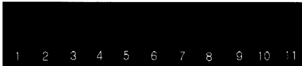
Fig. 1. Representative results of PCR amplification for (CCTTT) n region of iNOS gene.

의뢰하였고, PCR 기기는 TaKaRa (Japan)의 TP600 모델을 사용하였다. 실험 과정을 요약하면 다음과 같다. 채취한 혈액을 proteinase k를 미리 분주해 둔 시험관에 넣고 간단히 혼합한 뒤 -70℃에 약 2시간 보관하였다. 세포막을 터뜨리기 위해 0.2% SDS가 포함된 lysis buffer를 처리하고 56℃에서 10분간 방치한 뒤 원심분리하였다. 상층액을 따로 모으고 여기에 100% ethanol을 첨가하여 DNA가 분리되는 것을 확인한 후 다시 한 번 원심분리하였다. 상층액을 glass column 위에 부어 DNA만 순수하게 분리한 뒤 70% ethanol로 2회 세척하여 4℃에 보관하면서 필요할 때마다 분주하여 사용하였다. PCR primer는 GenBank (X97821)에 보고된 염기서열을 참조하여 제작하였다. (CCTTT) n 유전자 다형성 부분이 증폭될 수 있도록 하기 위하여 좌우 바깥쪽 염기서열을 근거로 하였으며 primer의 길이는 최소 17 bp 이상으로 하여 통계상 동일 게놈 (genome) 내에서 잘못된 염기가 증폭되는 일이 없도록 하였다. Sense primer와 antisense primer의 염기서열은 각각 CCTTCTCACAGCTTGCCACCCCTGG, AGAGGCTGCAGAGAGCTAT GGTCGC이었다. PCR 반응은 pre-denaturation을 94℃에서 5분, denaturation을 95℃에서 30초, annealing을 59℃에서 30초, extension을 72℃에서 30초로 하여 총 35회 반복하였다. 반응 후에는 post-extension을 위해 72℃에서 7분간 추가 반응시켰다. 반응이 끝난 PCR 산물은 TA vector에 클로닝한 뒤 DNA 염기서열을 결정하였다.