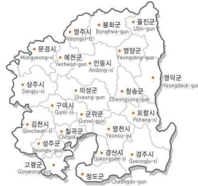
<그림 1> 연구대상지역

이를 위해 최근 4년(2004년~2007년)간 경상북도에서 발생한 교통사고를 대상으로 인구, 자동차 등록대