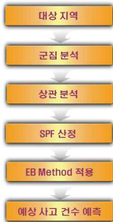
<그림 2> 연구 진행도