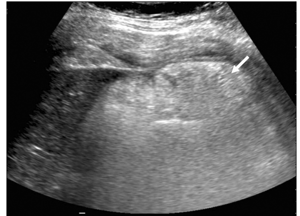
Fig. 1. Abdominal sonography shows an echogenic ill-defined mass-like lesion (arrow) in the subhepatic area.

환 자: 유○○, 남아, 10세 주 소: 내원 3일전 발생한 위상복부 통증 현병력: 평소 건강하게 지내오던 환자로 내원 3일전 부터 시작된 위상복부의 통증을 주소로 소아청소년과 외래 경유하여 입원하였다. 평소 변비 증상 보이지 않았고 구역이나 구토, 발열은 동반되지 않았다. 과거력: 생후 8개월 때 장중첩증 진단받고 수술에 의한 도수정복을 시행 받은 바 있으며 당시 충수돌기 제거도 함께 행해졌다. 가족력: 특이사항 없었다.