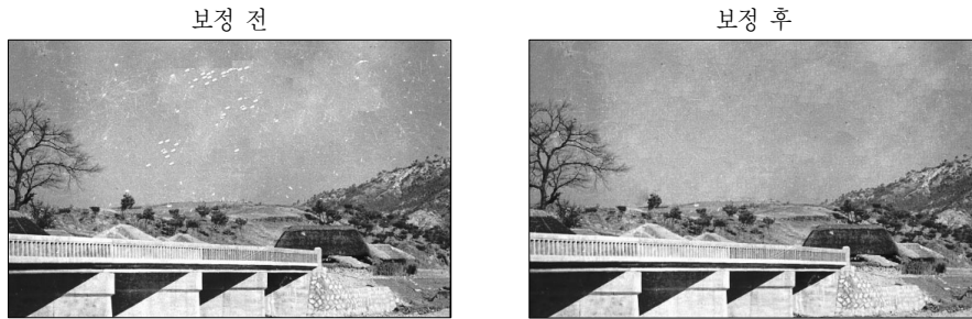
〈그림 3〉 잡티 보정 사례