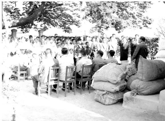
<그림 2> 훼손된 사진(필름) 사례

분진제거와 세척작업을 하여야 한다. 분진제거는 바람이 잘 통하는 곳에서 쌓인 먼지를 조심스럽게 제거한 후에 필름 세척 과정을 거치게 된다. 필름 세척은 증류수와 초음파 세척기를 통한 원본 필름에 가장 무리가 가지 않는 방법을 사용하였으며, 이전에 부여받은 고유번호를 중심으로 분류카드를 작성하고 연도별·주제별 분류를 위한 기록물을 재분류하여 보관용 필름파일에 구분하여 관리하였다.