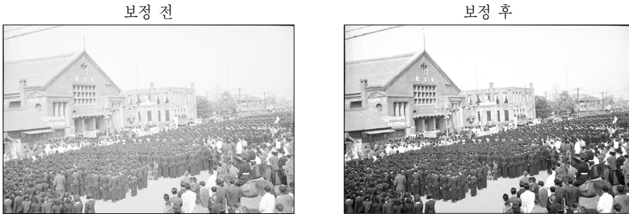
〈그림 4〉 색 보정 사례

보정은 스캐닝 중 불가피하게 발생하는 먼지, 잡티 얼룩 등을 Photoshop의 Clone Stamp Tool, Healing Brush Tool을 이용하여 보정하는 방법이다. 〈그림 4〉에서는 색 보정사례를 보여주고 있으며 이와 같은 색 보정은 스캐닝 현장별로 촬영해 둔 QP Card를 이용하여 Level, Curve 값을 설정하고 일괄 적용함으로써 이미지의 농도와 대비, 색상을 일관되게 유지하는 방법이다. 마지막으로 크기 보정은 파일의 Resize, 포맷 변환 작업은 Photoshop의 Autobatch기능을 사용하여 일괄 변환함으로써 수작업으로 인한 누락, 오류가능성을 최소화 하는 방법이다.