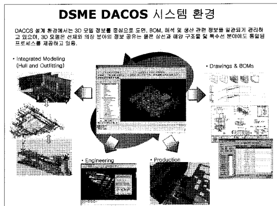
그림 1. DACOS 환경에서 모델을 중심으로 한 설계 정보의 생성

에는 대우조선에서 건조한 선박 및 해양구조물의 정밀한 3차원 모델과 도면 그리고 생산 과정에서 사용했던 자재 정보들이 포함되어 있다. 아래의 그림 1에서는 3D 모델을 중심으로 다양한 정보들이 생성되고 관리되는 DACOS 시스템의 구성을 보여주고 있다. 이러한 정보들을 관리하기 위해서 각 분야별로 필요한 시스템들을 자체적으로 개발하여 활용하고 있다. 앞으로는 기술 자료들이 양적으로도 늘어날 뿐만 아니라 그 내용들도 더욱 복잡해지기 때문에 PLM 기술을 활용하여 좀더 효율적으로 관리하는 방안을 연구 중에 있다. 당사에서는 차기 CAD 시스템을 검토 중에 있기 때문에 이와 연계하여 PLM 시스템을 함께 고려하는 방안을 추진하고 있다. PLM 시스템에서 관리해야 될 정보의 생성이 설계 시스템이라고 판단하고 있기 때문이다.