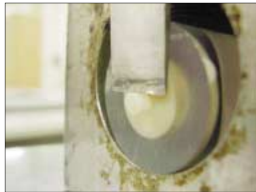
Fig. 2. Specimen in Instron machine (Bonding failure were conformed to measure shear bond strength between resin block and dentin).

미백 처리를 하지 않은 치아 (group-A)의 평균 전단 결합 강도는 20.11 MPa를 보였고, 미백 처리한 직 후 접착군 (group-B)의 전단 결합 강도는 6.36 MPa를 보여 미백 처리