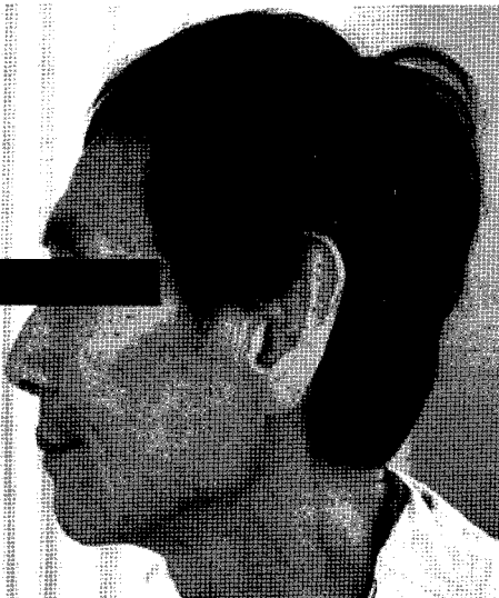
Fig. 1. Patient's Anterior View

+++severe, ++moderate, +mild, -eliminated