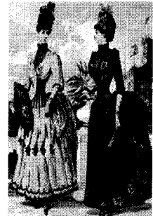
〈그림 5〉 직각으로 부풀린 Bustle Style, 『서양복식문화사』, p. 334.