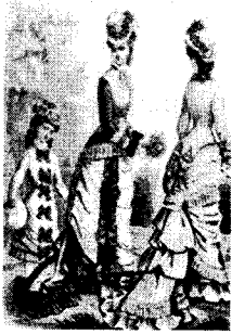
〈그림 3〉 장식적인 train이 달린 Bustle Style, 『서양복식문화사』, p. 333.