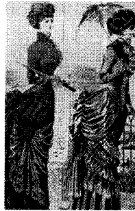
〈그림 4〉 hip이 강조되기 시작한 Bustle Style, 『서양복식문화사』, p. 333.