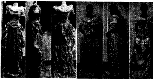
〈그림 6〉 '리진' 파티복 수정 전/후