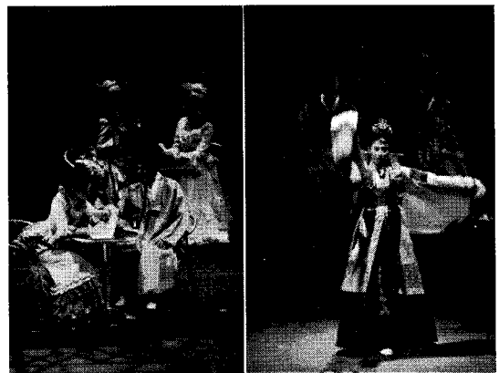
<그림 1> 서양복식과 한국전통복식으로 분리되는 공연<리진>의 무대의상

본격적으로 의상을 제작하기 전 무대의상디자이너는 제작회의를 통하여 연출자, 무대디자이너 및 장치제작, 조명 등등과 함께 의견을 나눔으로써 가장 효과적인 디자인을 창출해 내야한다. 제작회의 후 작품의 스타일과 각 분야의 디자인 개념이 정해지면 의상 디자인을 기획하고 의상팀을 구성한다. 공연 <리진>은 조선과 파리의 장소 구분이 명확한 작품이다. 작품의 배경이 되는 19세기 구한말의 조선복식과 19세기 말 프랑스의 복식은 구성, 실루엣, 소재에서도 확연한 차이를 보인다<그림 1>. 이러한 작품 구성상의 특징에 따라 의상팀을 '한국전통복식' 파트와 '서양고증복식' 파트로 구성하고 제작과정을 분리하여 효율적으로 진행함으로써 제작시간의 절약 및 제작비의 누수를 예방하였다.