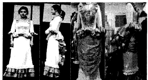
〈그림 7〉 '리진'의 외출복 수정 전/후