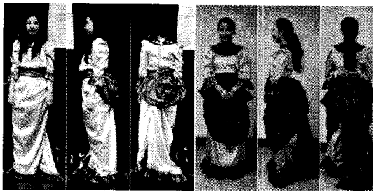
〈그림 8〉 프랑스女 파티복 1차/2차 수정