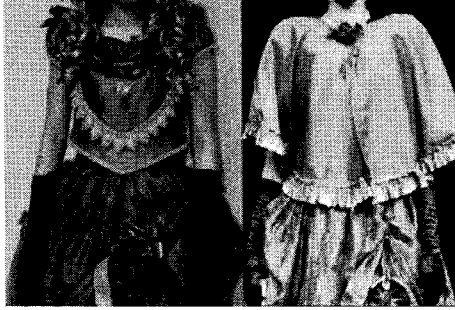
〈그림 10〉 의복구성의 보완-cape