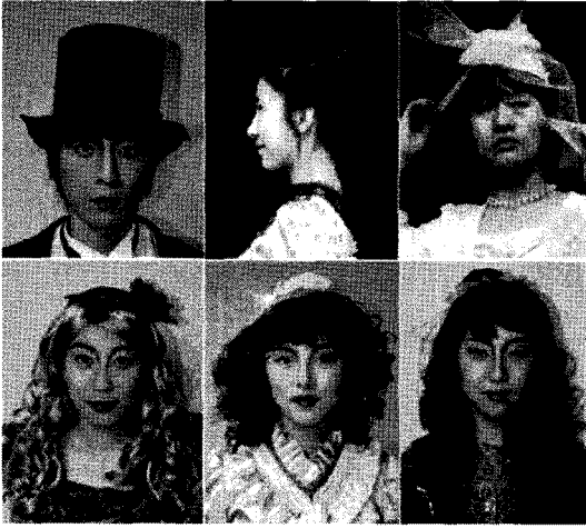
〈그림 14〉 모자를 이용한 시대복 연출

같이 커머밴드(cummerband)와 보타이(bow tie)를 착용하여 다양한 형태의 남성슈트에 시각적 통일감을 부여할 수 있다.