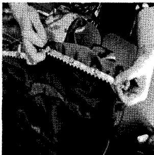
〈그림 15〉 드레스 여밈 수정

대여의상은 제작비와 제작 기간을 줄일 수 있는 장점과 더불어 예기치 못한 변수가 발생한다. 본 공연의 경우를 예로 들면 첫째, 사용하기로 한 중앙대학교 의류학과 의상은 철저한 고증을 바탕으로 한