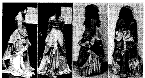
〈그림 9〉 프랑스女 파티복 1차/ 2차 수정

인 측면이 고려되어야 한다. 또한 무대 위의 다른 시각적 요소들과의 조화 및 통일성은 무대의상 디자인의 매우 주요한 요건이다. 그러나 무대 위에서의 시각적 통일감, 등장인물 성격, 배우의 신체사이즈 등 모든 요건을 충족시키는 대의의상을 찾기란 거의 불가능하며, 다수의 동일한 시대의상을 확보하는 것 역시 한계가 있다. 무엇보다 대의의상은 반납 시 원본의 상태로 복구해야 하기 때문에 세심한 디자인 구상과 작업계획이 요구된다.