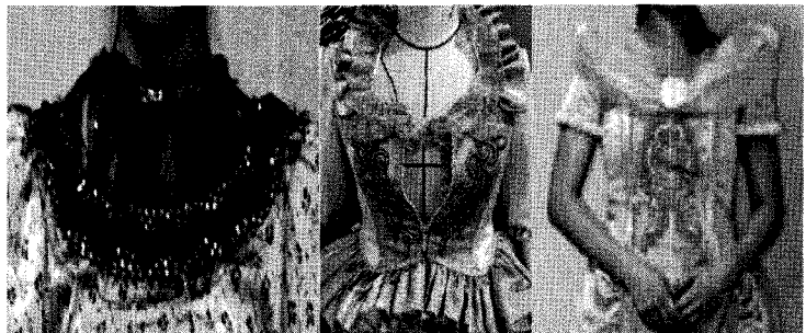
〈그림 16〉 시각적 효과를 높이는 장식적 요소 가미