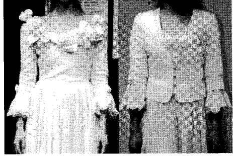
〈그림 11〉 의복구성의 보완-jacket