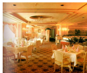
<그림 9> 롯데호텔 라세스 (1979, 김원석)

고도기술사회의 첨단화의 추구하고 주위환경과의 부조화 과거에 대한 향수 등의 표현하였다. 이는 서양의 경우 20세기 전반부를 대표하였고, 한국의 경우 70년대 까지 가장 즐겨 표현되었던 모더니즘적 사고에 대한 재해석과 반 모더니즘의 양대 축으로 표현이 진행 되었다. 서양의 경우 1960년대 중반에 기본 개념이 처음 형성된 뒤 70년대 잠복기를 거쳐 80년대에 가장 융성했다. 한국의 경우 모더니즘의 후발로 볼 수 있으며 토속적인 분위기가 청년문화의 낭만을 반영한 것이라면 장년층의 우아함과 럭셔리한 분위기를 표현하였다.