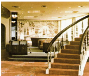
<그림 5> 경주호텔 커피숍 (1977, 배만실)

세계적으로 획일화되어가는 디자인 양상에서 벗어나고 한국적 정체성을 표현하기 위하여 한국 전통건축의 특성을 적용, 응용하였다. 자연과의 조화, 채와 간으로 나눔으로서 나타나는 공간의 연속성이나 폐쇄성, 건축적 요소로서 서까래 우물천장, 창살, 지붕의 곡선이나 형태, 문양, 패턴 등을 인용하기도 하며, 전통가구나 소품 등으로 표현하기도 하였다.