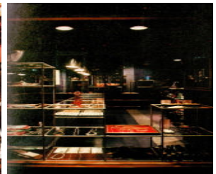
<그림 8> 보석점 모네 (1976, 김원)