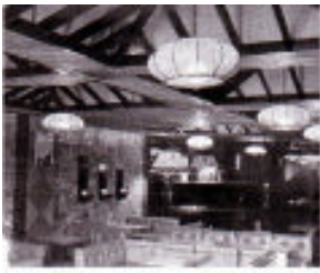
<그림 3> 늘봄 (1977, 손석진)

낭만적이고 감성적 분위기를 연출하기 위해서는 토속적인 형태와 재료, 거친 마감처리, 강렬한 원색을 사용하였다.