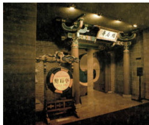
<그림 6> 롯데호텔 포석정 (1979, 정도성)