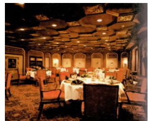
<그림 10> 롯데지하그릴 (1978, 김철)

형태적 특성을 살펴보면 서양의 경우 과거의 형태를 현대적 재료와 병치하고, 기둥, 페디먼트, 아치, 돔, 궁형지붕, 삼각형 천장의 형태, 그래픽요소, 동물이나 식물의 형태, 가벽사용과 보색대비, 주조 색 없이 동등한 색을 사용하였다, 파스텔조의 풍부한 색을 사용하기도 하며, 과장된 스케일이나 팝아트적 요소로 장식하여 표현 한다. 그러나 한국의 경우 서양의 표현과는 많은 차이점을 가지고 있고, 기하학적 형태를 곡선, 두터운 물딩을 함께 사용하여 표현하며 금박, 실크등의 화려한 마감재를 즐겨 사용하였다. 주로 대형 홀, 고급 레스토랑, 고급호텔 룸, 예식장에서 럭셔리함을 표현하고자 할 때 많이 표현되었다.