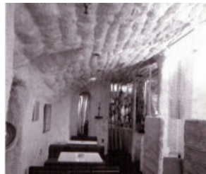
<그림 4> 파파 (1975, 손석진)