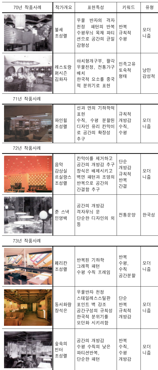
<표 2> 한국실내디자인의 연도별 표현 특성 및 유형 분류

KOSID작품집과 참고문헌들을 조사한 결과 상업공간 작품 중 실내의 표현 특성이 잘 나타난 작품을 위주로 34개의 작품의 표현 특성과 유형을 연도별로 분석하였다.