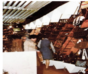
<그림 7> 신세계 가방코너 (1974, 송명규)

현 한다. 금속재료의 사용은 공간을 화려하고 럭셔리한 분위기로 표현되고, 직선적 요소와 금박 등을 차용하고 절제하여 표현한 금속성, 기계미, 유리의 사용으로 공간의 확장감을 표현한 투명성과 노출성으로 정의할 수 있다.