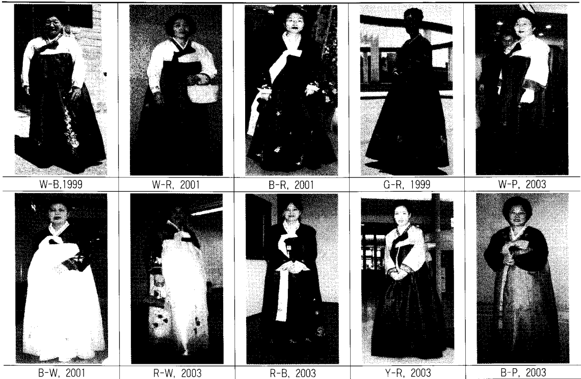
<표 5> 이색배색에서의 배색유형

게 장식하여(표 5 R-B) 산뜻한 느낌을 강조한 디자인들이 다수 보였다. 치마에서는 연두, 청록이 감소한 대신 초록과 보라가 증가하여 해가 갈수록 중간색상들에 대한 선호도가 낮아지고 산뜻한 색상이 선호되고 있음을 보여주었다. 공통적으로 회색과 갈색, 주황색은 저고리와 치마 모두 거의 사용되지 않았다.