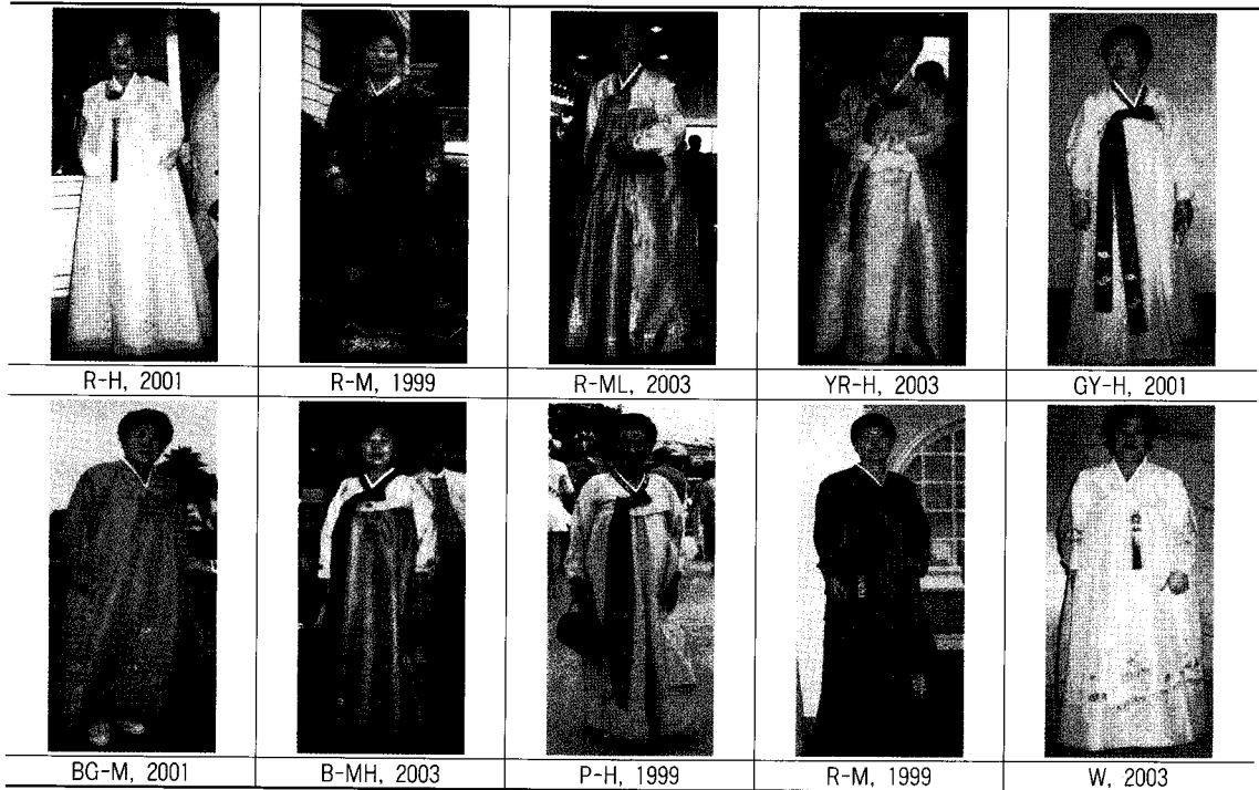
〈표 3〉 동색배색에서의 배색유형

15.6%(1999년), 11.09%(2001년), 13.5%(2003년)를 차지하였다. 그리고 중명도의 빨강 즉 분홍색도 비교적