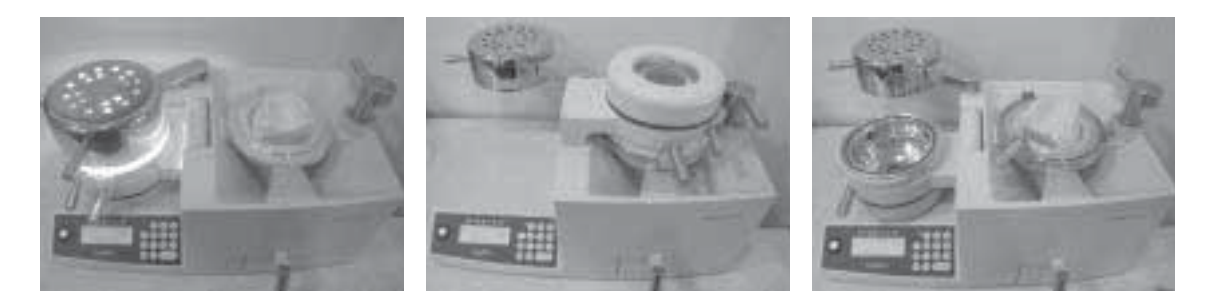
Fig. 2. 단층법으로 마우스가드 제작

용하여 재질별(EVA, PE), 제작회사별(Scheu, Dreve, Tru-Tain), 두께별(1.5, 3.0, 4.0mm)Thermoforming Materials(이하 시트)로 단층의 마우스가드를 제작하였