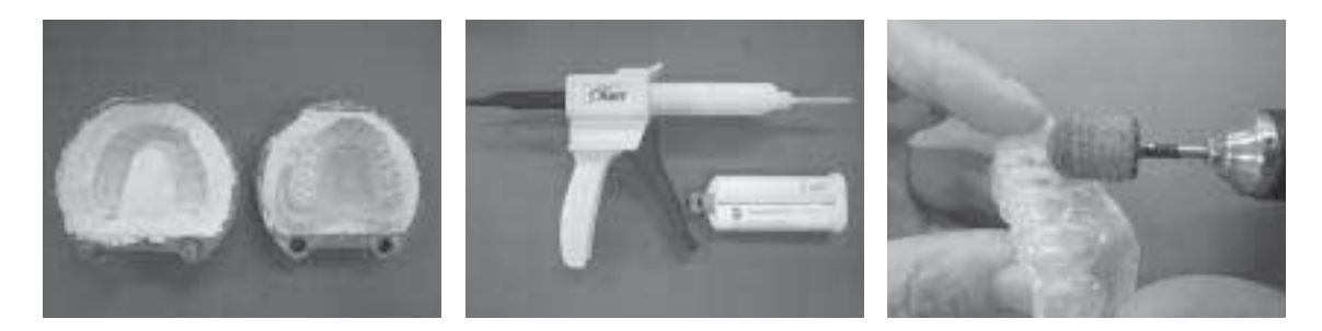
Fig. 4. Silicone 마우스가드 제작

작은, 먼저 제작된 EVA재질(두꼐 3.0mm)의 마우스가드 (Bioplast)를 이용하여 매몰법으로 silicone 마우스가드를