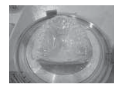
Fig. 3. 적층법으로 마우스가드 제작

bond(Scheu, Germany)를 도포하였다. 그리고 1.0mm 두 께의 soft한 시트(Bioplast, Scheu Dental, Germany) 또는 1.0mm 두께의 hard한 시트(Impleron"s", Scheu Dental, Germany)를 추가로 성형하여 마우스가드를 제