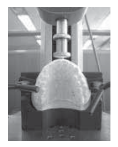
Fig. 5. 파절실험기

England), Press(Multitest 1, AND, Korea), Computer (DatePlot 프로그램이 설치된),Model Holder로 구성되 었다(Fig. 5).