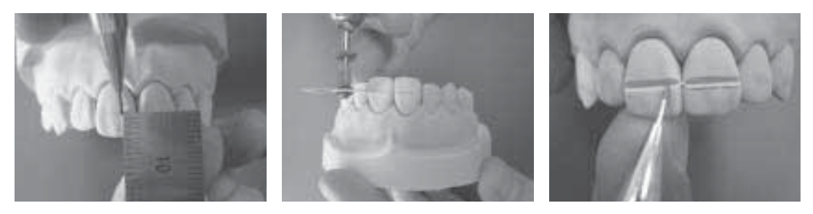
Fig. 1. 파절실험 모형제작

치아가 압력을 받을 때 항상 일정한 위치에서 파절되도 록 하기위해서 기본 모형의 양중절치순면(절단에서 5.0mm 하방)에 notch(폭, 깊이 1.0mm)를 형성하여 파절실험용 기 본모형을 제작하였다(Fig. 1). 제작된 파절실험용 기본모 형을 silicone으로 복제하여 mold를 제작한 후 초경석고