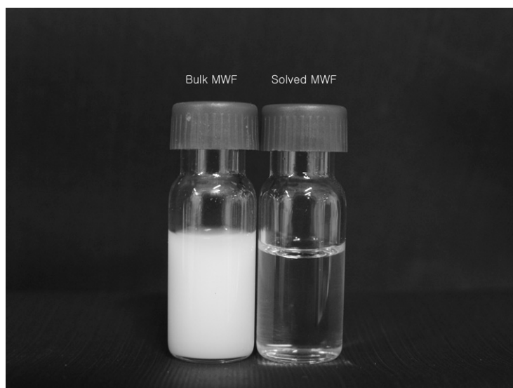
Figure 2. Solubility test for MWF used in test field.

NIOSH 5524번(DTM 방법)이 발표되기 전까지 금속가공유의 측정방법으로 알려진 방법들은 모두 비수용성 금속가공유만을 분석하는 방법이었다. NIOSH 0500번 역시 단순히 금속가공유 취급공정에서의 공기 중 총 분진 또는 흉곽성 분진을 채취하여 분진의 무게로서 평가하는 방법으로, 공기중에 금속가공 도중 발생하는 금속파편이 부유하거나 금속가공