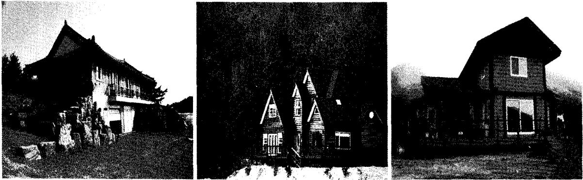
▲ [그림 5] 자연과 가족건강을 추구하는 사람들의 집

“해가 지고 어슴푸레 땅거미가 지기 시작하면 마을 한 켠에선 바비큐 파티가 벌어집니다.