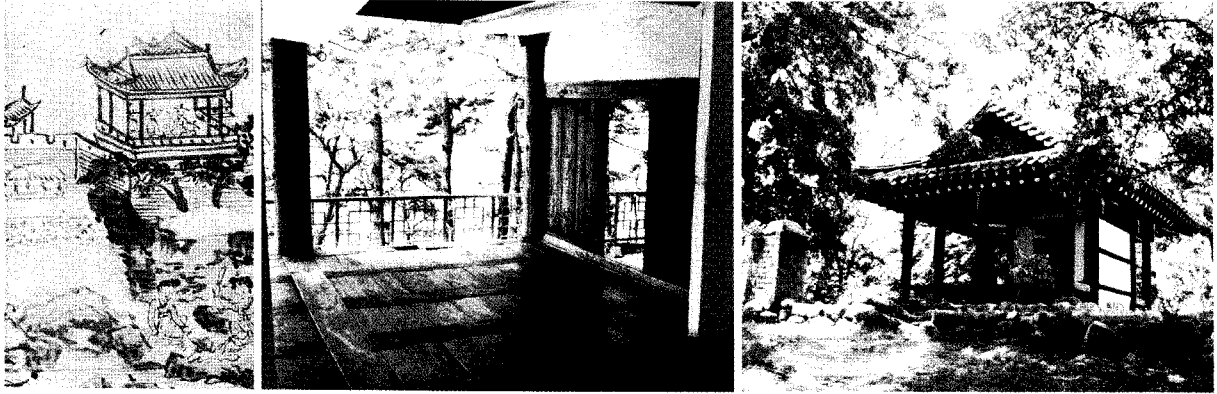
▲ [그림 1] 조선조 선비들 이상향의 장소 정자

동품) 따위도 진열하는 장소와 배치하는 법이 네 격에 맞아야 비로소 그림과 같은 느낌을 주는 것과 같다. 윤림당과 청비각에서 키 큰 오동나무와 고풍스러운 바위 가운데 깨안도 하나. 침상 하나를 놓게 되면 사람으로 하여금 주인이 풍치를 상상하게 하여 참으로 정신과 뺏속이 다 같이 상쾌함을 느끼게 만든다. 그러므로 운치를 지닌 선비가 거처하는 곳은 문에 들어서기만 해도 일종의 고아함과 속됨을 벗어난 아취를 바로 느끼게 되는 것이다.” 7) 고 하여 당대의 공간에 대한 제도적 인식과 질서를 강조하면서 공간의 고아한 품격과 수준에 대한 해석도 하였다. 이처럼 조선의 선비들은 집 자체의 기능보다는 자연의 풍광이 좋은 곳에서 맑은 기운이 형성되고 이를 통하여 심신의 다스림을 취하고자 하여 집의 생기와 거처의 기운을 중요시 하였다. 그러므로 거의 순환이 되는 집의 물리적인 터를 중요시하였으며 일상 집기도 그러한 관점의 질서있는 배치를 권장하였다. 이는 성리학적 질서와 선학들의 자연관을 수용하기도 하였지만 일상 선비의 행위가 생활 일부에 직접 참여하는 일들은 무관하고 학문과 시서화의 교류 등과 같은 고아함과 품격에 어울리는 개념적 거처공간을 추구하였기 때문인 것으로 보여진다.