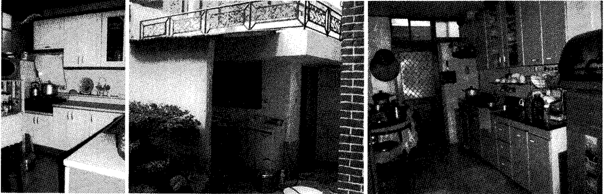
▲ [그림 3] 문화촌의 개조된 부엌의 모습과 여전히 가사노동의 한 영역인 세탁기가 정당한 제 자리 없이 외부공간에 설치되어(중앙 사진) 있다.

다는 통계적 보고(통계청, 1988)와 견주어 보면 전주도 이와 비슷한 양상으로 보여진다. 이러한 부엌의 실내 입식화는 '80년 이후 아파트의 양적인 폭주와 더불어 일반인들에게 부엌의 전환 의식에 큰 영향을 주었다. 한편 1980년대 중반에는 아파트에 가스보일러가 설치되었으며 가전제품의 양이 이후 기하급수적으로 늘어나기 시작하였다.