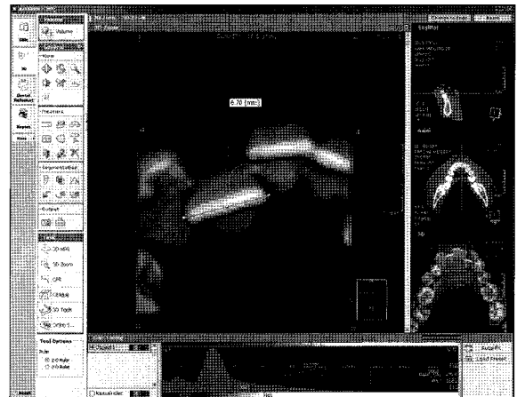
Fig 2. Volume rendering model of CBCT data constructed using Accurex ver 1.0. 3D zoom mode was applied and displayed in the main window for measurement of lower left lateral incisor width. The thresholding ranges of teeth 3 preset that were used in this study are shown in the fine tuning tab on the bottom of the program window.