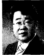
이 한 성

Class of ART Algorithms," International Computer Science Institute, TR 98-004, 1998.