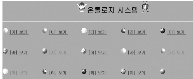
〈그림 11〉 온톨로지 탐색 인터페이스