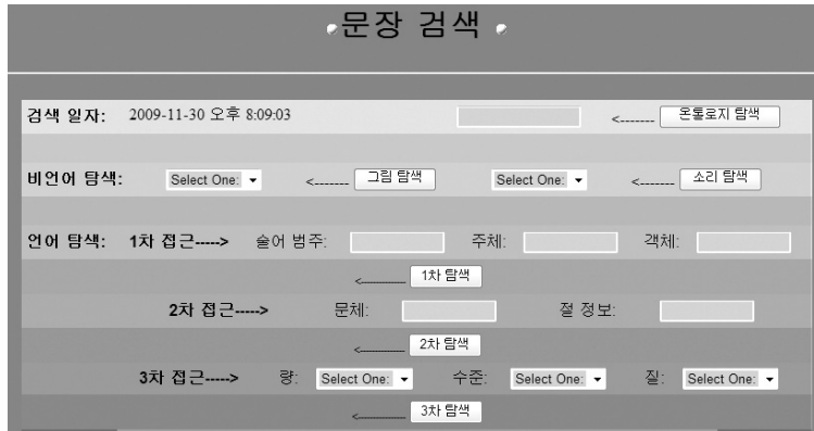
〈그림 10〉 문장 검색 인터페이스

치한 것이다. 그림이나 소리 버튼을 클릭하면 순서에 입각하여 〈그림 7〉에 나열된 wordnet의 명사 범주어를 색인으로 삼은 사진들이 출력되고 마음에 드는 사진을 클릭하면 그 것에 대응한 이야기, 단락, 문장들이 모두 출력된다.