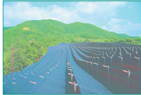
〈그림 1〉 금산 인삼포

금산은 대전-통영간 고속국도, 국도 13, 17, 37호선, 국지도 55호선, 지방도 635호선 등이 지나는 광역교통체계 역할을 담당하고 있으며, 대부분의 간선도로들이 금산읍을 중심으로 형성되어 수도권, 영호남, 대전을 연결하는 교통의 요충지라 할 수 있다.