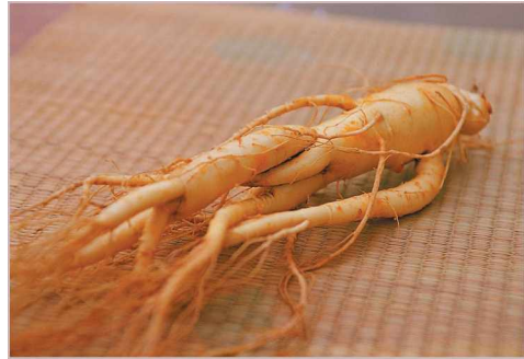
〈그림 2〉 금산인삼

케어 어머니께 달여 드렸더니 모친의 병은 완쾌되었고, 그 씨앗을 남이면 성곡리 개안이 마을에 심어 재배하기 시작하니 이것이 우리고장에서 처음으로 인삼을 인공적으로 재배하게 된 것이라고 하며, 인삼의 모양이 마치 사람의 모습과 비슷하다 하여 人蔘이라고 불리게 되었다고 한다.