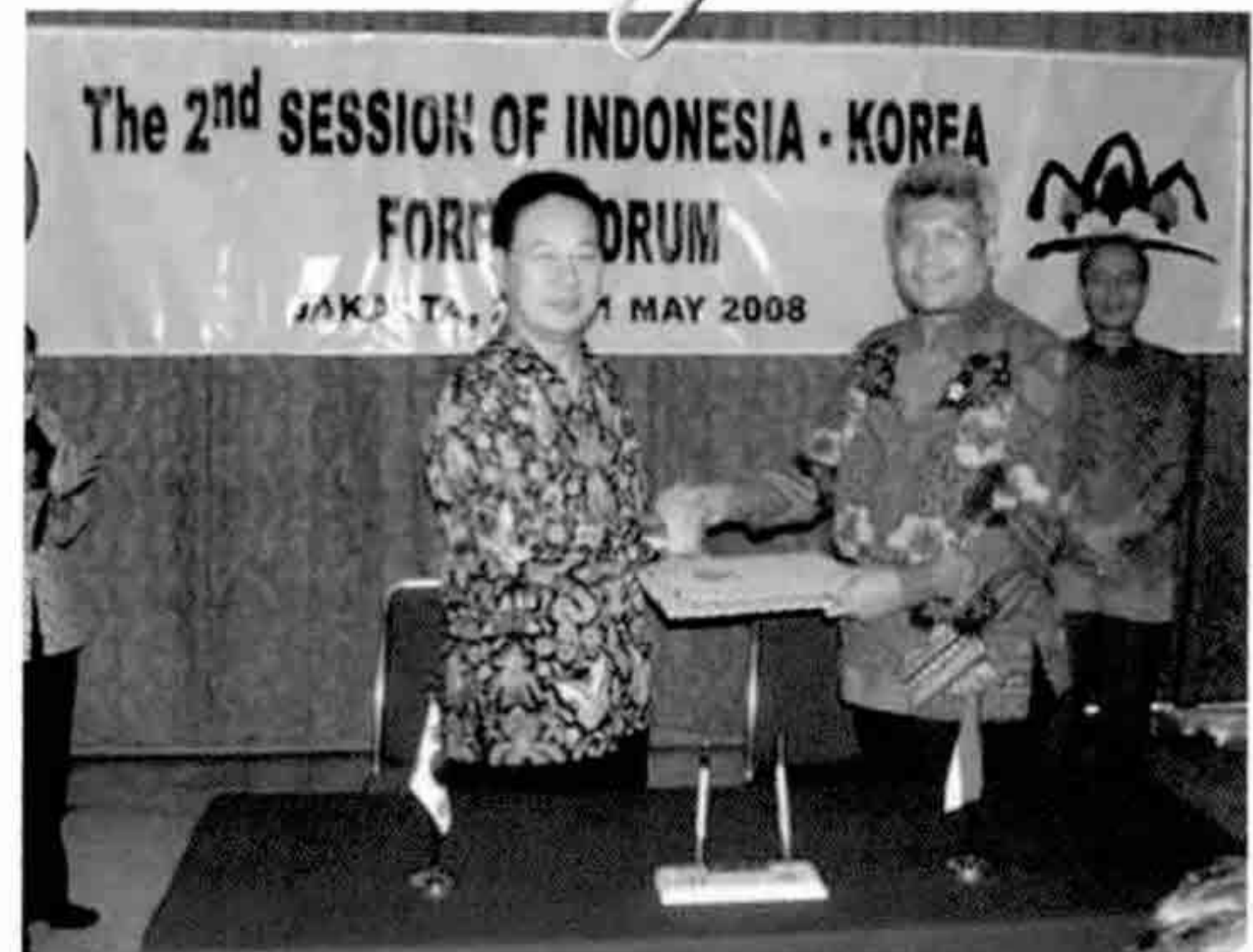
한·인니 기후변화 대응 및 임업 협력 증진 MOU 체결

박람회는 산림산업 활성화와 산림환경에 대한 국민적 이해를 높여 산림강국의 새로운 비전을 제시하기 위해 국내 최초로 산림박람회를 개최하게 됐다.