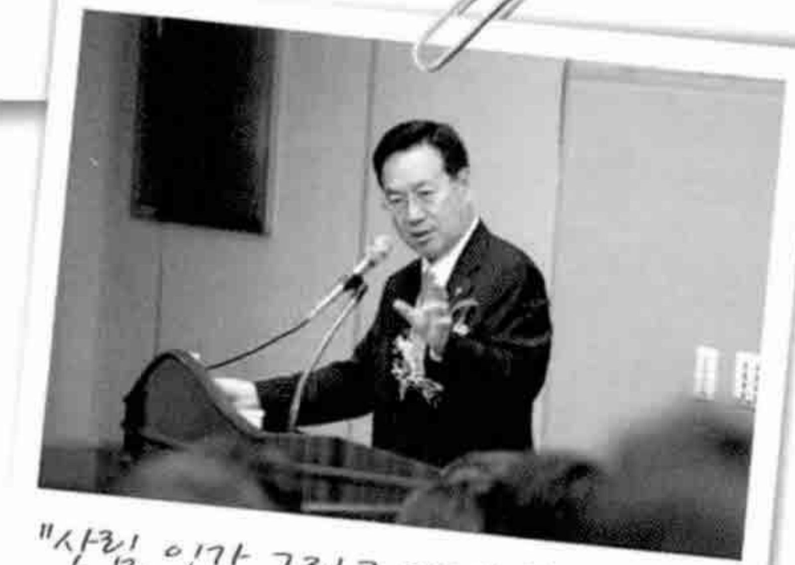
"산림, 인간 그리고 미래" 특강

하영제 산림청장은 13일 충남대학교 농업생명과학대학에서 산림과학 전공 대학생 150여명을 대상으로 산림이 주는 혜택과 미래 산림의 중요성을 강조한 "산림, 인간 그리고 미래"라는 주제로 특강을 하였다.