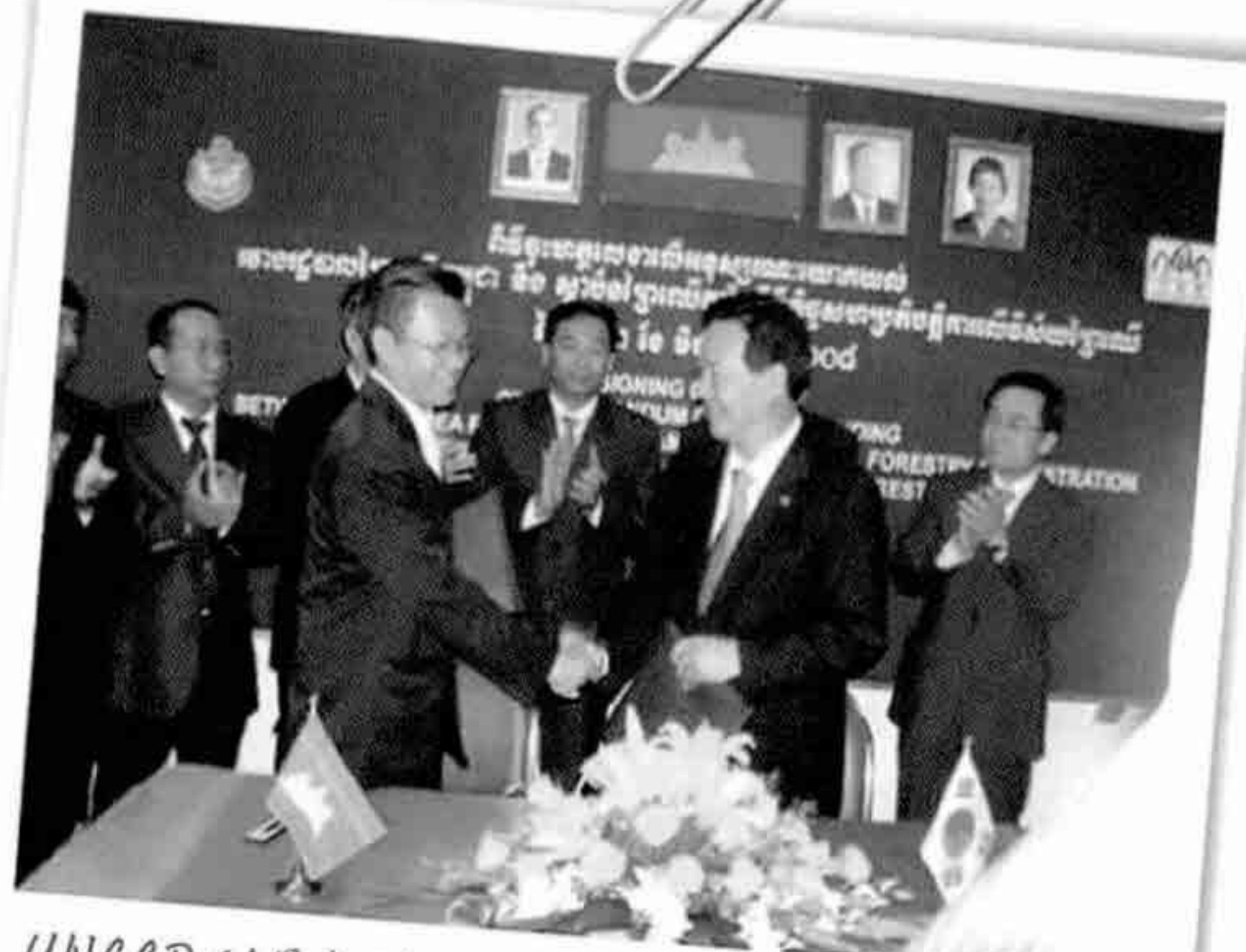
UNCCD 사무총장 면담, 동북아 사막화 방지 위한 공동노력 협약