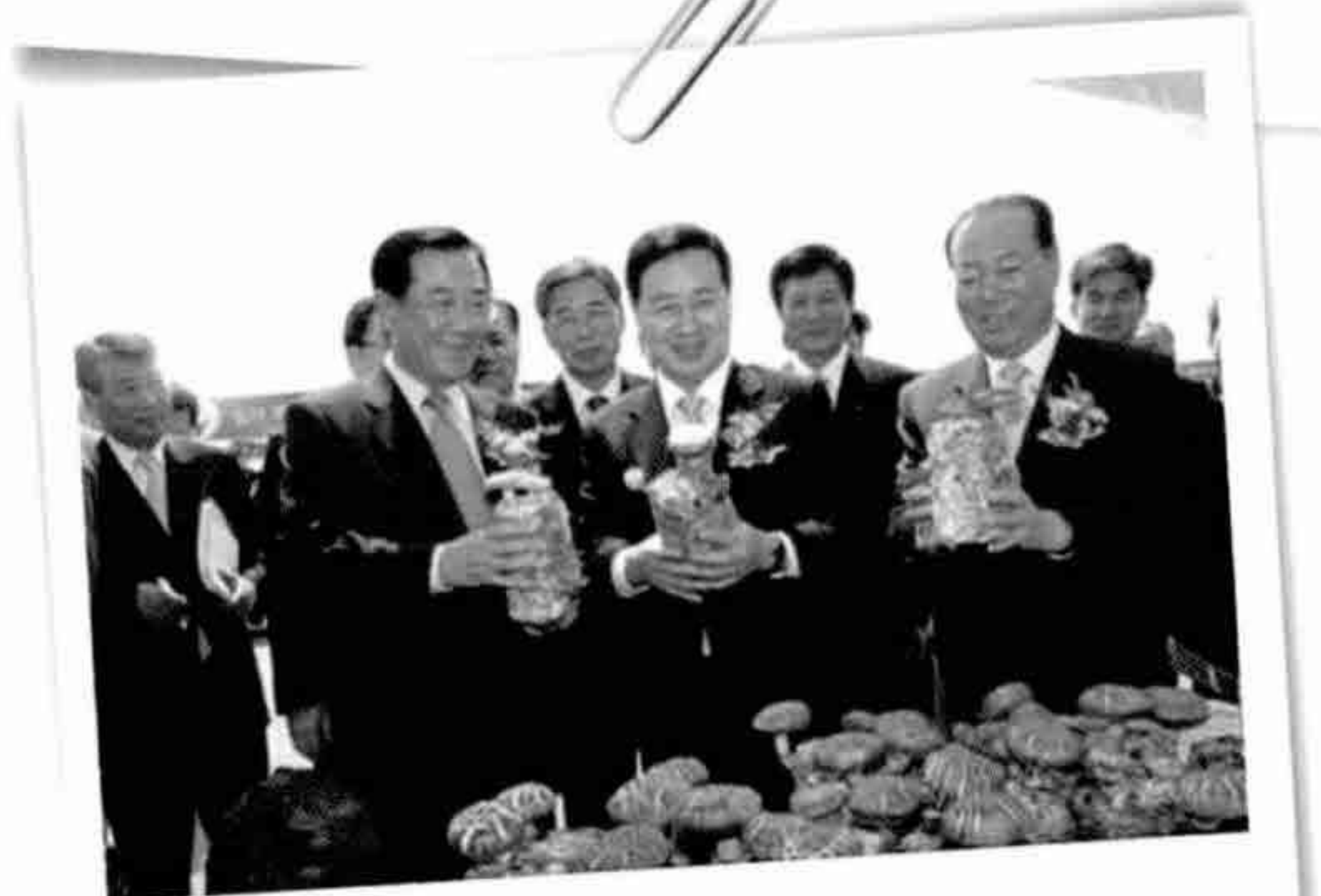
2008년 산주와의 만남