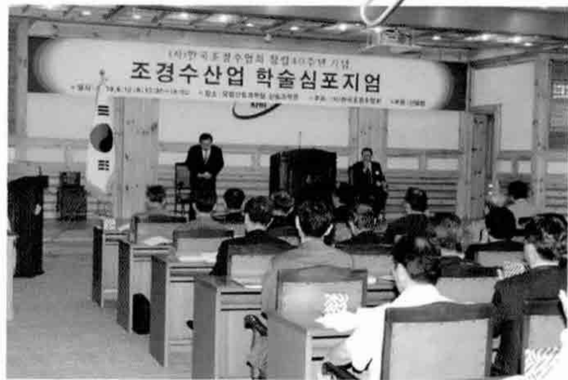
산림청, 조경수 산업 발전 모색 학술심포지엄 개최