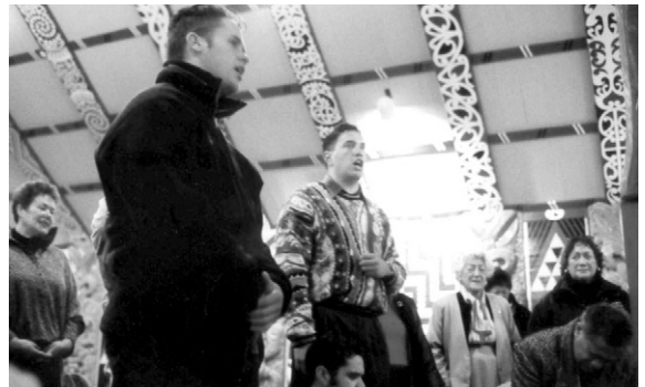
사진 1. Students at Marae