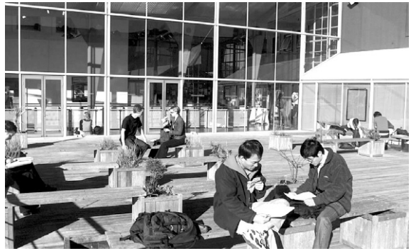
사진 2. unionplaza

뉴질랜드 교육부는 “뉴질랜드 내 외국 유학생들의 보호 및 관리를 위한 실천요강 (Code of Practice for the