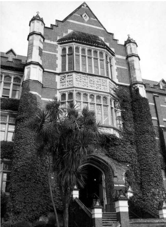
사진 4. Ivy on Hunter Building

development에서 특별 국가 대상으로 장학금을 제공하고 있다. 우수연구를 격려하기 위하여 우수한 외국인 박사과정 학생들에게는 국내 학생 수업료에 적용되는 학비만을 받는 제도가 있으며 외국인 유학생들은 졸업 후 경력을 향상시키기 위한 1년 취업비자도 신청할 수 있다.