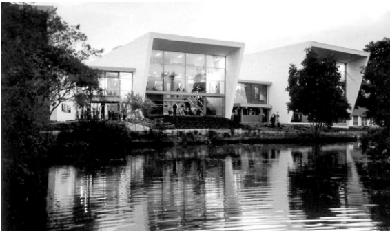
사진 3. WAI Academy