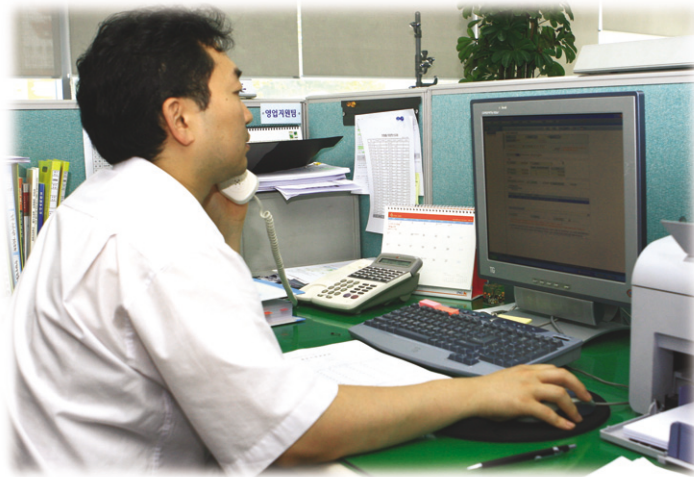
▲ 대한설비건설공제조합은 조합원사의 편의를 위해 인터넷을 통한 전자약정 서비스에 들어갔다.

대 한설비건설공제조합은 2001년 7월에 동종 업계 최초로 인터넷 보증을 시행한 이후, 조합원사에 편의를 제공하기 위하여 조합 방문과 서류 제출 없이 인터넷을 통한 약정업무를 할 수 있도록 전자약정서비스를 2008년 7월 1일 시행합니다.