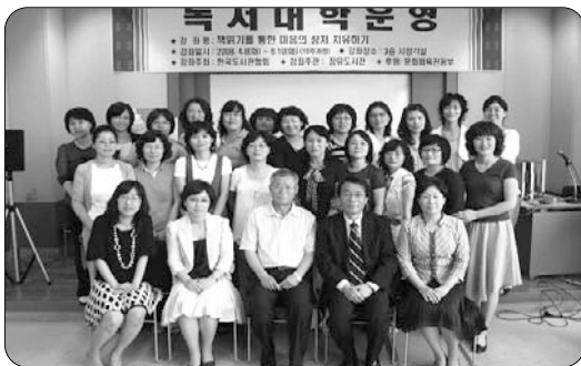
[경상남도 김해장유도서관 수료식]