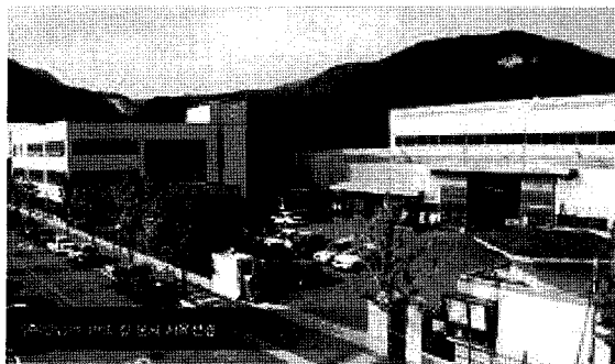
(주)엘림테크메디칼 본사 사옥전경

엘림테크메디칼의 오기나와는 전세계 선진국의 대표적인 스웨덴, 네덜란드, 독일, 호주, 뉴질랜드, 오스트리아 등에서 친환경인증마크를 받은 황금빛의 친환경적인 건강 보료소재를 사용함으로써 고객에 대한 신뢰성을 확보하였고 진정한 로하스 의료기기로 오기나와의 사용자들에게 각광받고 있으며 또한 전자파가 원천 제거되고 내구성이 매우 우수한 무자계발열체를 사용함으로써 오랜 기간을 사용하여도 전자파발생이 없고 화재로부터 안전하다.