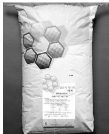
▲ 울트라 에디락-양계

▲ '울트라 에디락-양계'는 세계 3대 사료첨가제 회사인 인베뉴트리애드사에서 개발한 양계전용 질병관리 및 생산성 향상제품으로 사료에서 장까지 양계건강을 전체적으로 관리해줘, 양계 사료에 첨가해 급여 시 항생제 없이도 건강하게 양계를 사육하고 생산성을 향상시킬 수 있도록 만들어주는 제품이다.