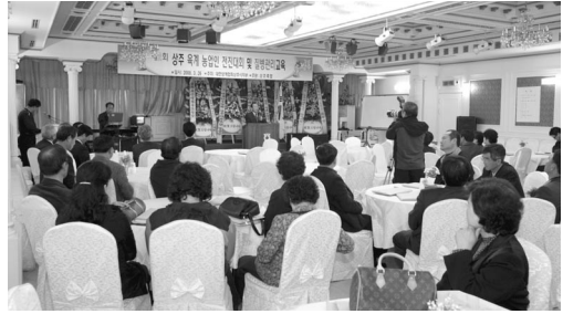
일 상주농협예식장에서 제 2회 상주육계 농업인 전진대회를 개최했다. FTA협정과 DDA협상과 함께 사료가격까지 급등하면서 현안문제를 파악하기 위해 대회를 실시했다. 특히, 경북대학교 수의학과 김기석 교수를 초빙해 국내 육계생산성 제고로 효율적 질병관리 방안에 대해 강의가 진행되었다.