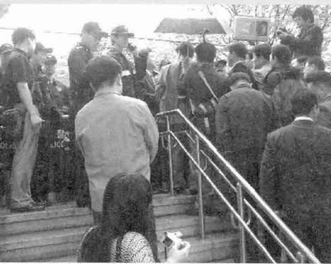
어.. 못 들어가네.. 기자회견 후 농림수산식품부장관 항의방문을 예정했으나 장관의 일정으로 차관을 면담하게 해주겠다고 했는데 이마저도 몇 명만 들어보낸다고 청사 안으로 한농연 대표단의 진입을 경찰이 막고 있다. 결국 이날 농림수산식품부 면담과 항의서한 전달은 무산되었다.