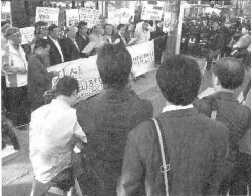
파격적인 협상결과에 농민단체, 범국민운동본부 소속 대표자와 실무자들이 많이 모였고 또한 많은 기자들과 역시 기자회견에 동참(?)하는 몇 배가 넘는 우리 경찰들의 모습도 보인다.