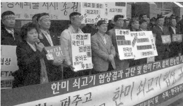
이빈파 광우병쇠고기 서울감시단 이빈파 공동대표도 소비자, 학부모의 입장에서 규탄발언을 하고 있다.