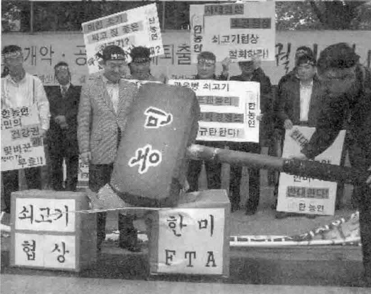
기자회견 중 조공협상인 쇠고기협상과 굴욕적인 한미FTA를 농민들의 힘으로 분쇄하겠다는 결의로 퍼포먼스를 하고 있다.