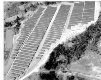
해남 태양광 발전소 1MWp