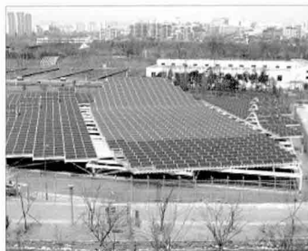
청계천 유지정수용 정수장 310kWp