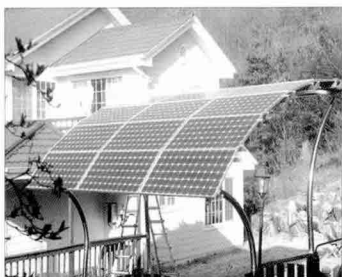
주택보급사업 설치 3kWp

심포니에너지(주)는 2004년 11월 연간 10MW규모의 태양광 모듈 자동화 생산라인을 준공하여 신재생에너지보급센터 주도 124세대 270kWp를 바탕으로 하여 국내시장에 첫발을 내딛었으며 에너지관리공단이 주관한 '2005년 주택보급사업 베스트 콘테스트'에서 최우수상을 수상하였고 적극적으로 마케팅 및 개발을 통한 국내 최고의 기업으로 자리매김하고자 최선의 노력을 경주하고 있다. 국내 최초로 2005년도에 태양광 모듈 부분 독일 TUV의 'EC61215' 국제 인증을 획득, 2007년도에는 국내인증 획득하였고, 오스트리아의 OVE인증도 획득한바 있다. 현재 지속적으로 여러 국제 인증 획득 추진 중에 있으며 이러한 노력의 결과로 심포니에너지(주)는 빠른 속도로 성장하였고 2007년 연간 매출액 718억을 달성하였다.