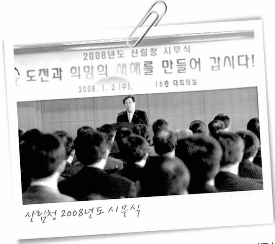
산림청 2008년도 시무식

산림청은 2일 대회의실에서 전직원이 참석한 가운데 시무식을 갖고 무자년 새해 업무를 시작했다. 서승진 산림청장은 인사말에서 지속가능한 발전과 행복한 삶을 뒷받침하는 열쇠이자 지구환경의 중심에 서있는 우리 산림을 가꾸고 보전하는 일에 최선을 다해 달라고 당부했다.