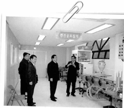
가평군 산림조합 잣 가공센터 방문

산림청은 2일 대회의실에서 전직원이 참석한 가운데 시무식을 갖고 무자년 새해 업무를 시작했다. 서승진 산림청장은 인사말에서 지속가능한 발전과 행복한 삶을 뒷받침하는 열쇠이자 지구환경의 중심에 서있는 우리 산림을 가꾸고 보전하는 일에 최선을 다해 달라고 당부했다.