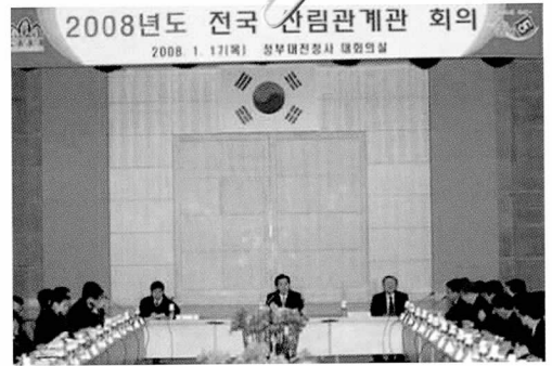
포토뉴스 2008년도 전국 산림관계관 회의

서승진 산림청장은 15일 가평군 산림조합 잣 가공센터를 방문, 이우식 가평군산림조합장의 안내를 받으며 잣 가공센터 시설을 둘러본 후 "생산자와 소비자 모두에게 이익이 되는 특화사업으로 발전시켜주길" 당부했다.