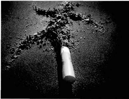
흡연은 뇌졸중 발병을 2배이상 증가시키므로 당뇨병환자는 절대 흡연해야 한다

또한 고지혈증의 관리도 중요하데, 당노가 있는 경우 혈압과 마찬가지로 고지혈증에 대한 관리 기준이 더 엄격해야 한다. 물론 고혈압이나 흡연 유무, 그리고 나이 등에 식이요법, 운동 및 약물 치료를 적절하게 조합하여 뇌졸중을 예방해야 한다.