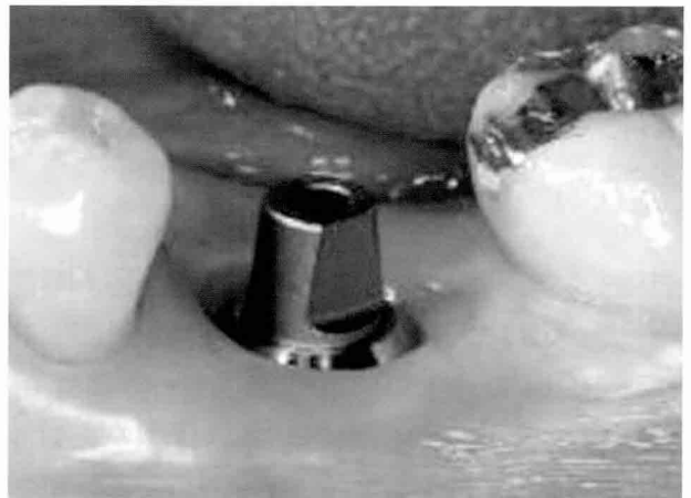
물방울 레이저로 임플란트를 시술한 당일의 모습 - 붓기와 출혈이 전혀 보이지 않는다

즉, 기존의 수술법대로 수술칼로 잇몸을 절개하게 되면 과도한 출혈, 출혈로 인한 통증과 붓기, 감염위험성, 치료기간 증가 등의 문제가 있었다. 그러나 물방울의 에너지를 이용한 '물방울 레이저'로 잇몸을 조