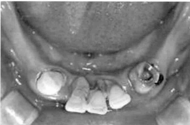
노벨가이드 임플란트 시술전

둘째, 잇몸절개가 없으므로 출혈이 없어 면역이 떨어진 당뇨병환자에게 적합하다,