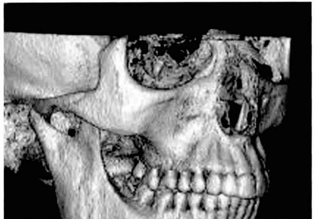
컴퓨터 단층촬영을 통한 뼈밀도의 확인

먼저, 당뇨병환자가 부작용 없이 편안하게 치과 임플란트 치료를 받기 위해서는 수술을 최소화 하는 것이 중요하다. 즉, 과거의 치과 수술의 경우, 치아를 빼고 임플란트를 할 때 잇몸을 수술칼로 연 후 장시간 동안에 임플란트 드릴로 잇몸뼈를 뚫고, 적당한 곳에 치과의사의 어림짐작으로 임플란트를 심게 되어 시간도 오래 걸리고 통증도 많이 따르는 것이 사실이었다. 특히 당뇨가 있는 경우에는 더욱이 임플란트 치료를 받기 힘들었다.