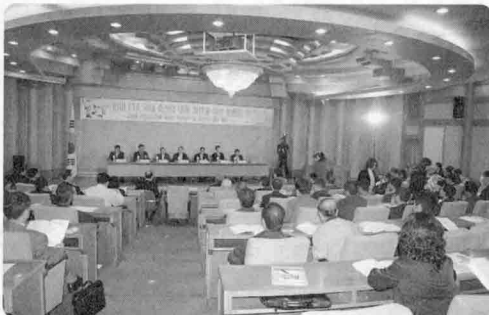
관련사진은 지난해 11월 14일 국회의원회관 소회의실에서 개최된 육우군납관련토론회 현장

○ 협회의 지속적인 대정부·대국회 활동 결과, 2008년 국회 예산(안) 심의에서 군납용 수입쇠고기의 일부를 국내산 육우로 전환하기 위한 41억원의 예산(순증액)이 최종 통과됨(12.28) - 군 장병 1일 쇠고기 섭취량(35g)에서 수입 쇠고기(25g)의 일부인 5g을 국내산 육우로 전환(연 880톤 가량 공급)