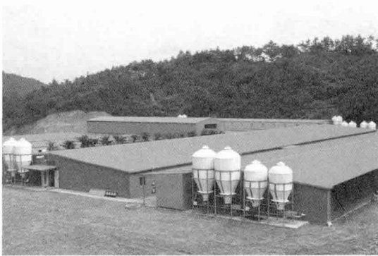
▲ 2007년 충남 부여에 완공된 도암 제2농장 전경