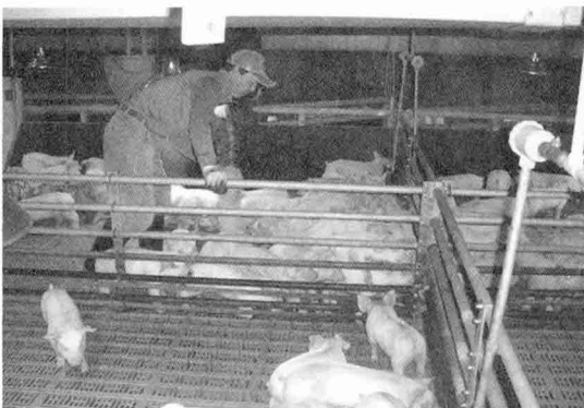
▲ 모돈사, 농장기록