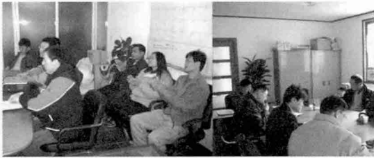
▲ 도암농장은 농장의 목표를 구체적으로 실천하기 위해 매달 생산성 분석회의, 격월로 팀장 교육을 실시하고 있을 뿐만 아니라 정 사장 스스로도 경영자 교육을 격월로 받고 있다.

기록관리 교육뿐만 아니라 직원 정신소양 교육을 통해 도암농장에 대한 목표를 공유하고 있다.