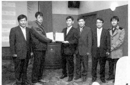
▲ '2008년 도암농장 전략수립 목표회의'를 통해 농장 구성원 뿐만 아니라 파트너들에게 도암농장의 목표와 비전을 설명하고 이를 위해 협력해 줄 것을 당부하고 결심하는 자리를 마련했다.

“내 농장의 목표를 파트너들이 숙지하고 있지 않다면 목표를 이룰 수 없다”며 도암농장과 농장에 관계된 사업 파트너들에게 목표를 공유하고, 농장의 목표를 위한 노력들이 혼자 해 나가는 것이 아니라 거래하고 있는 사료회사, 동물약품회사 등과 사업적인 동반자관계를 구축하여 각자의 필요한 역할을 수행하도록 하고 있다는 설명이다.