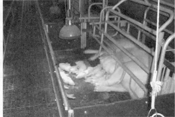
▲ 금보육종은 최근 축산물HACCP기준원으로부터 HACCP 농장으로 지정받아 우수한 위생방역 시스템을 갖춘 청정 강원도의 종돈장임을 대내외적으로 인정받은 계기를 마련했다.