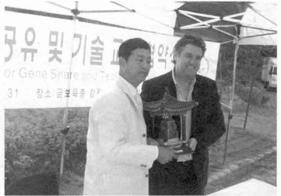
▲ 강원 GGP농장은 신축과 함께 전문군을 세계적인 육종회사인 캐나다의 세계적 육종회사 제네수스와 미국의 알도사로부터 GGP 종돈 전량을 도입해, PRRS음성농장 실현했다.