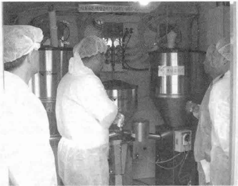
▲ 쾌적하고 위생적인 사양환경 관리를 위하여 신축된 원주 GP에는 최첨단 독일식 자동액상급이라인을 설치했다.