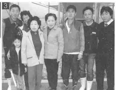
1 주원산오리 코스요리 전문점 "오릿대"에서의 식사장면 2 사육농장 3 도압장에서의 모습