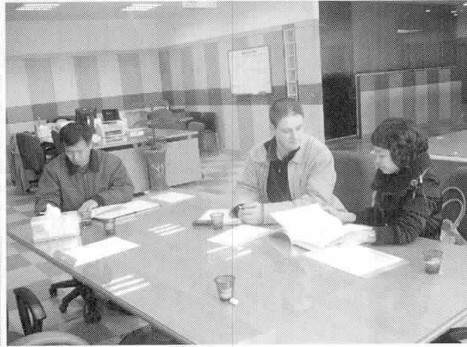
▶ 로렌트, 다영푸드 방문