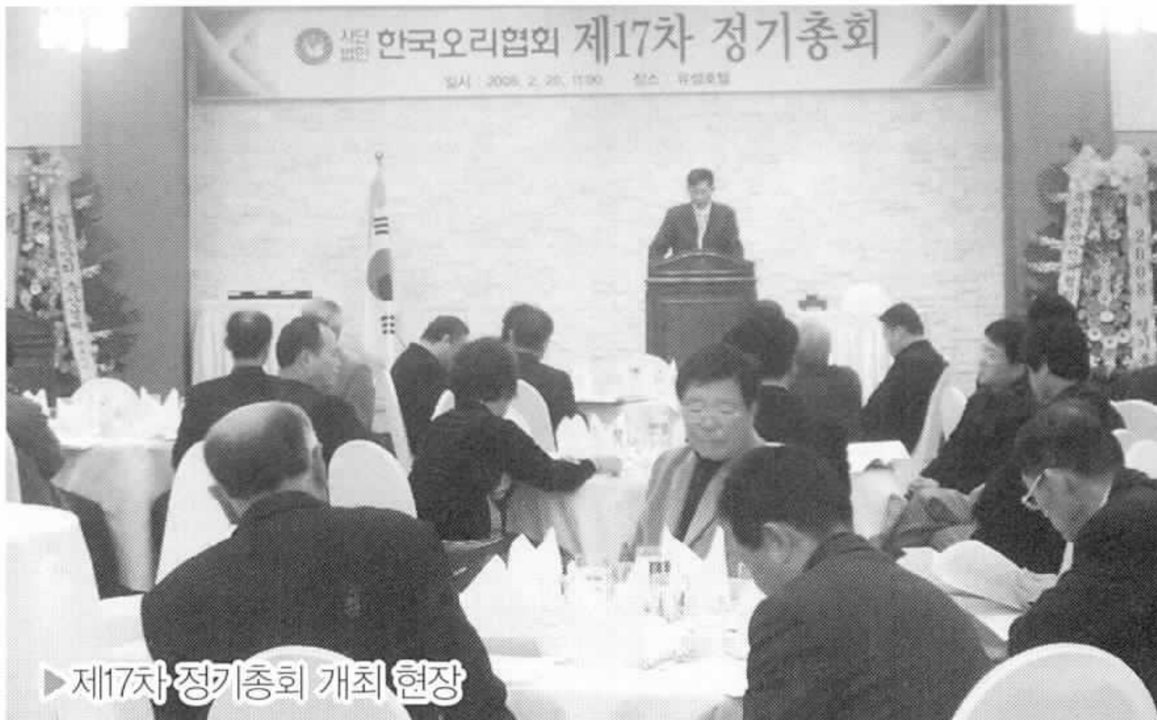
▶ 제17차 정기총회 개최 현장