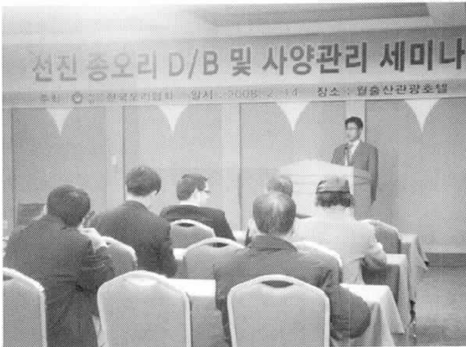
▶ 종오리 DB 및 사양관리 세미나