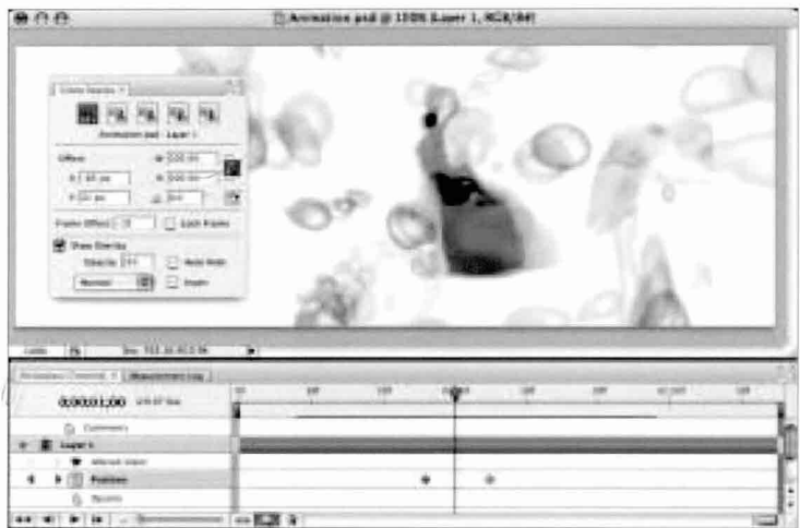
포토샵 CS3 익스텐디드는 영상 그래픽 전문가들을 위해 새로운 클론 소스 팔레트가 추가, 복제 및 복구 기능, 오버레이 미리보기, 타임라인 기반의 편집기능이 강화된 애니메이션 팔레트, 8비트에서 32비트까지 원본 비디오 레이어 기능 등이 추가되었다.

⑧ 내보내기 > 비디오 렌더를 선택한다. 이 대화창은 다른 애플리케이션에서 활용할 수 있도록 비디오 작업물을 바로 내보낼 수 있도록 한다. 포토샵 CS3 익스텐디드는 쿼타임, 윈도우 미디어 등 다양한 모션 그래픽 포맷으로 불러오고 내보낼 수 있다. 포토샵 CS3 익스텐디드 상의 비디오 레이어는 그레이스케일, RGB, CMYK, 랩 이미지, 8, 16, 32 비트 HDR 컬러, 필름용 파일 포맷 등을 지원한다. 또한 색상 조절 등도 가능하다. 포토샵 PSD 파일은 추가된 비디오 레이어를 포함하여 따로 컨버전 하거나 압축할 필요 없이 어도비 프리미어 프로나 애프터이펙트에서 바로 연동하여 작업할 수 있다. Ⓞ