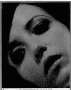
Zoomify 내보내기는 고화질 이미지를 웹 상에서 효율적으로 볼 수 있도록 해준다.