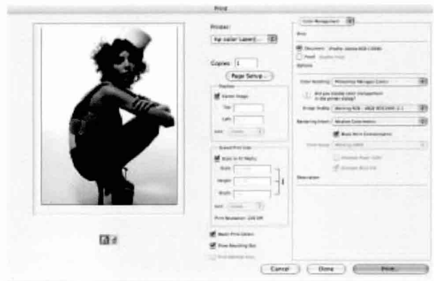
Photoshop CS3에서 이미지를 연 다음 파일>인쇄를 선택해 새로운 인쇄 창을 표시함으로써 보다 간단해진 인쇄 기능을 경험할 수 있다.

어도비 포토샵 라이트룸(Adobe Photoshop Lightroom)은 어도비 포토샵 제품군으로 전문사진작가 및 DSLR 사용자들을 위한 디지털 이미징 전문 솔루션이다. 특히 이 제품은 고화질 디지털 사진 보기, 관리, 보정 등에 대한 전문가들의 요구에 맞추어 개발되었다. 라이트룸은 카메라 로(Camera Raw)와 같은 이미지 엔진을 사용하고 있으므로 양쪽 애플리케이션 간 변환 세팅 등이 호환되며, 포토샵이나 라이트룸에서 변경한 사항은 양쪽 소프트웨어에 자동으로 적용되게 된다. 또한, 포토샵에서 편집한 이미지를 저장하면 변경 사항은 곧바로 이미지들을 관리하는 라이트룸 라이브러리에 반영된다. 이러한 기능을 통해 사용자는 소프트웨어 애플리케이션 및 플랫폼 사이에서 작업을 원활히 수행할 수 있다.