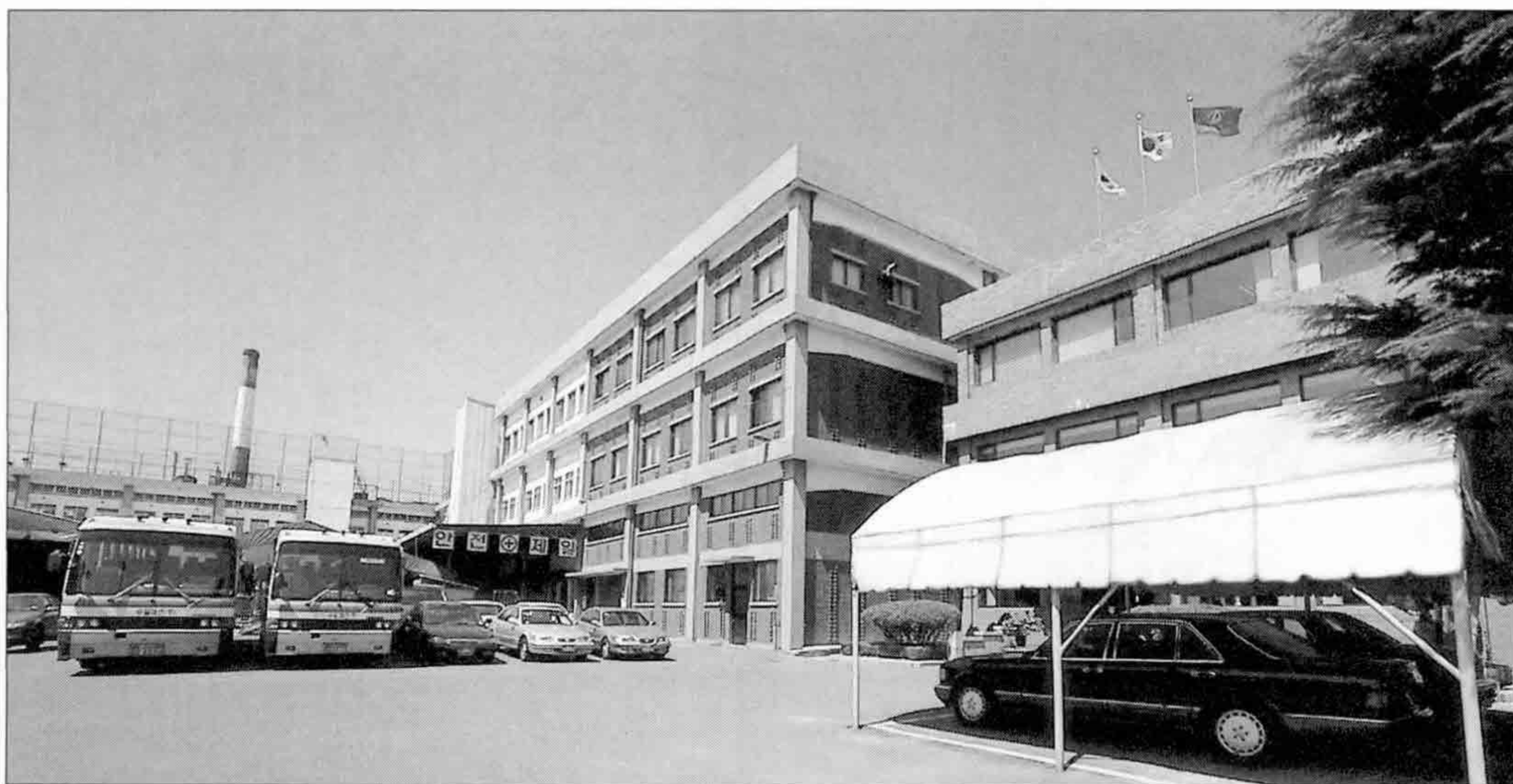
▲ 인천시 서구에 위치한 (주)승일의 제1사업장

르기까지 모든 소비자의 욕구를 충족시키는 에어졸 제품의 종합 메이커로 독보적인 위치를 고수하고 있다.