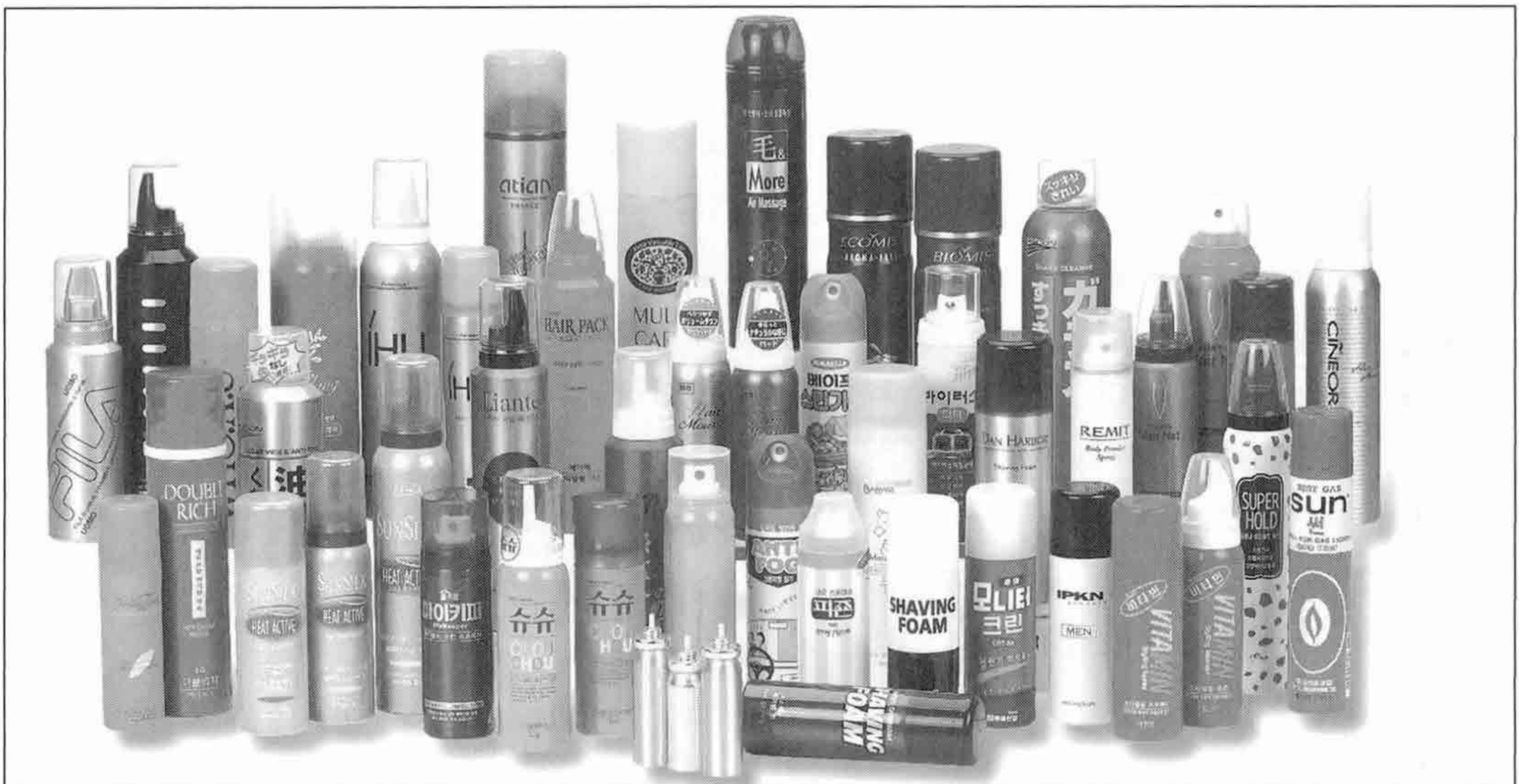
▲ (주)승일이 생산하는 에어졸 제품

화장품에서부터 의약외품, 생활용품, 산업용품에 이르기까지 널리 활용되고 있는 에어졸 제품은 그 구조가 다종, 다양하여 입자의 크기, 분사량, 분사 각도 등 제품의 특성 및 용도에 맞는 확실한 기술